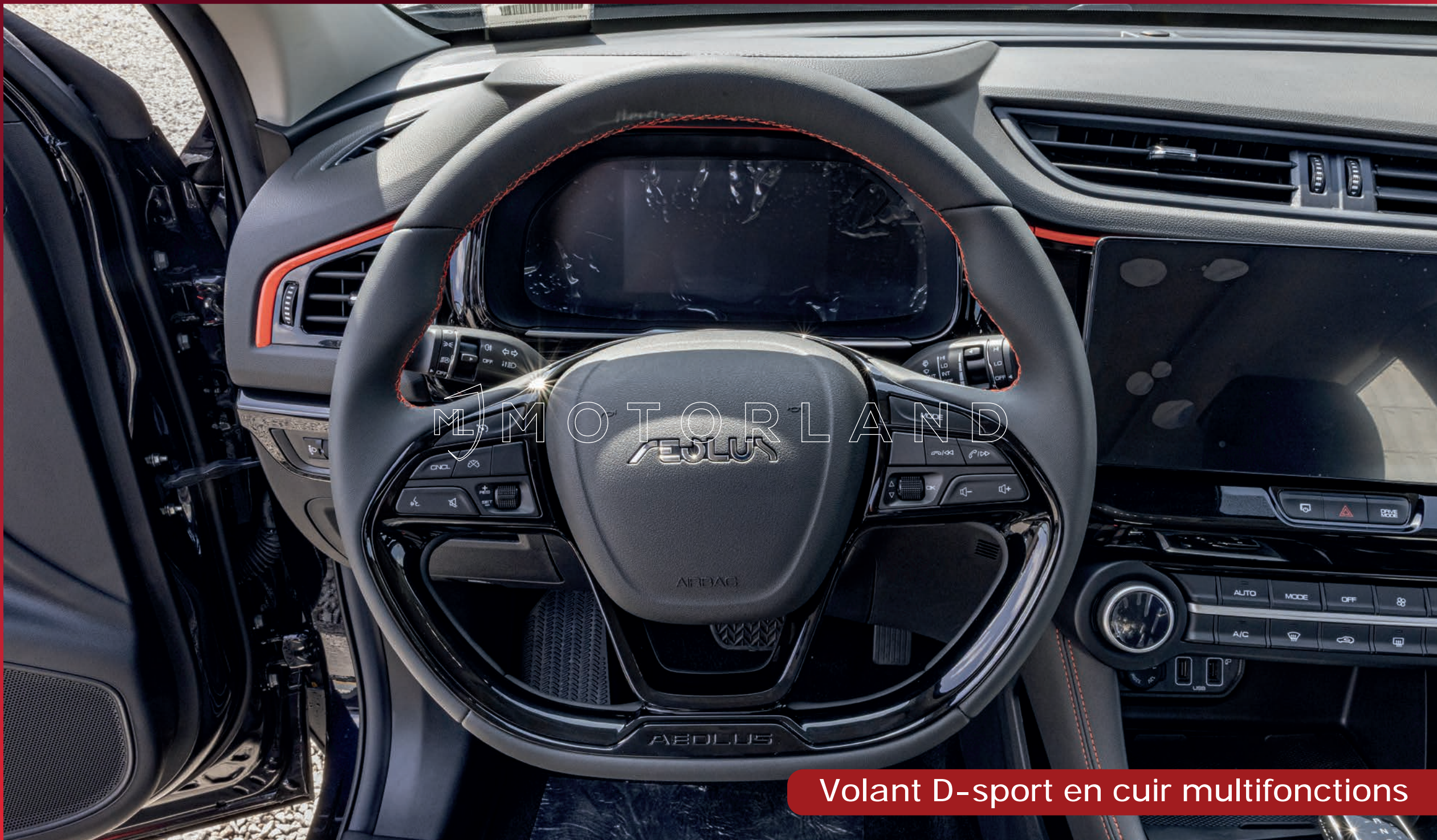
Volant D-sport en cuir multifonctions