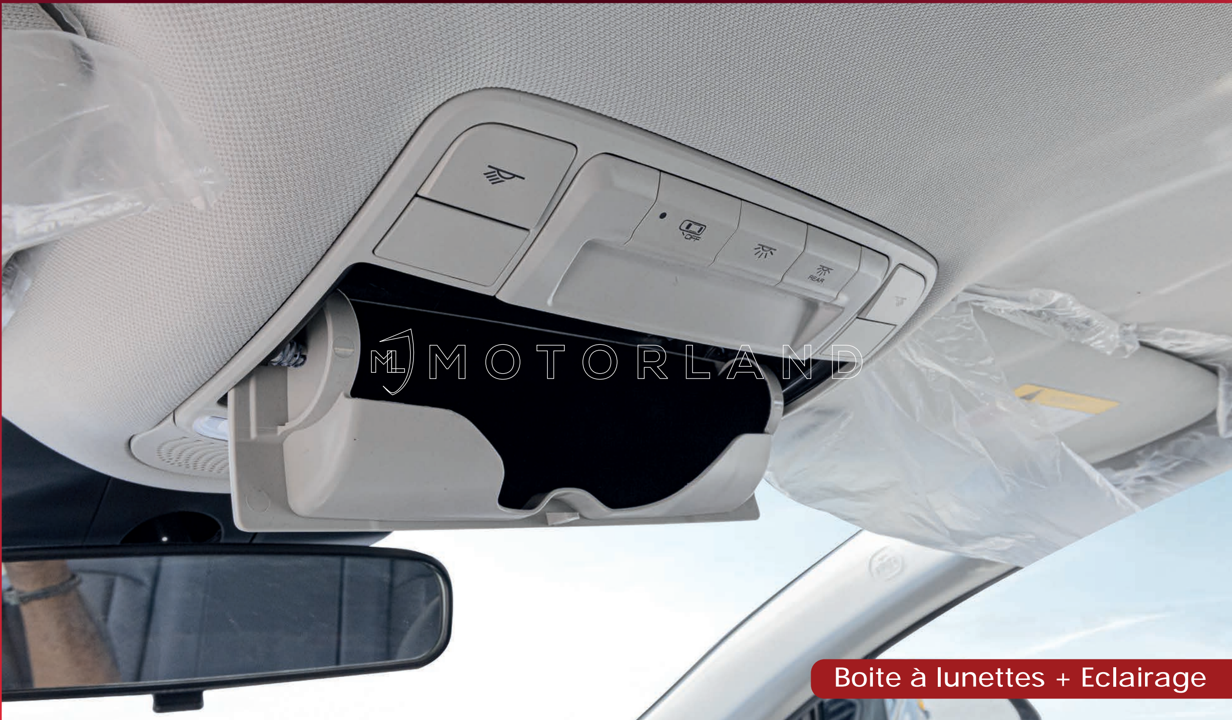
Boîte à lunettes + Eclairage