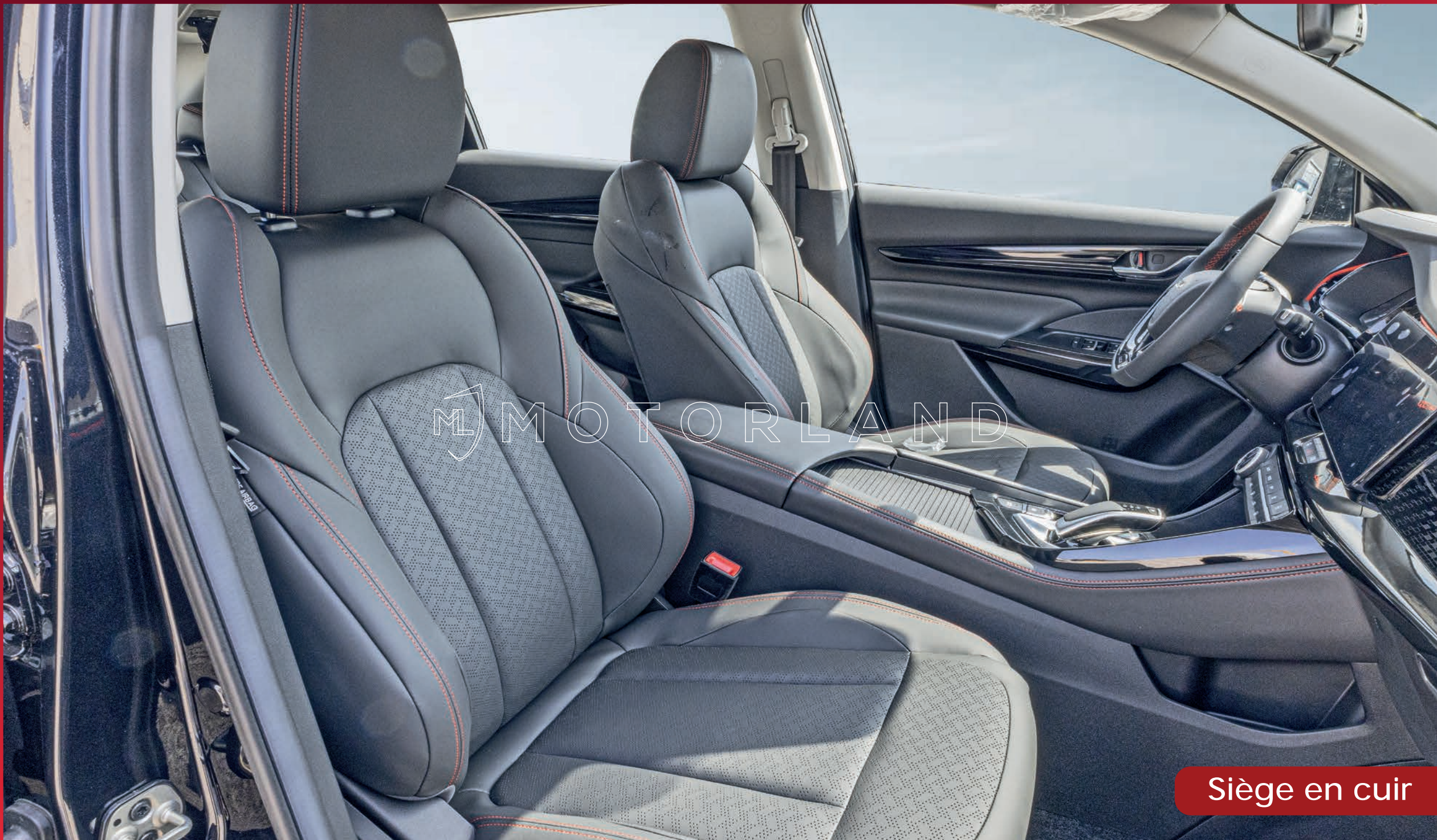
Siège en cuir