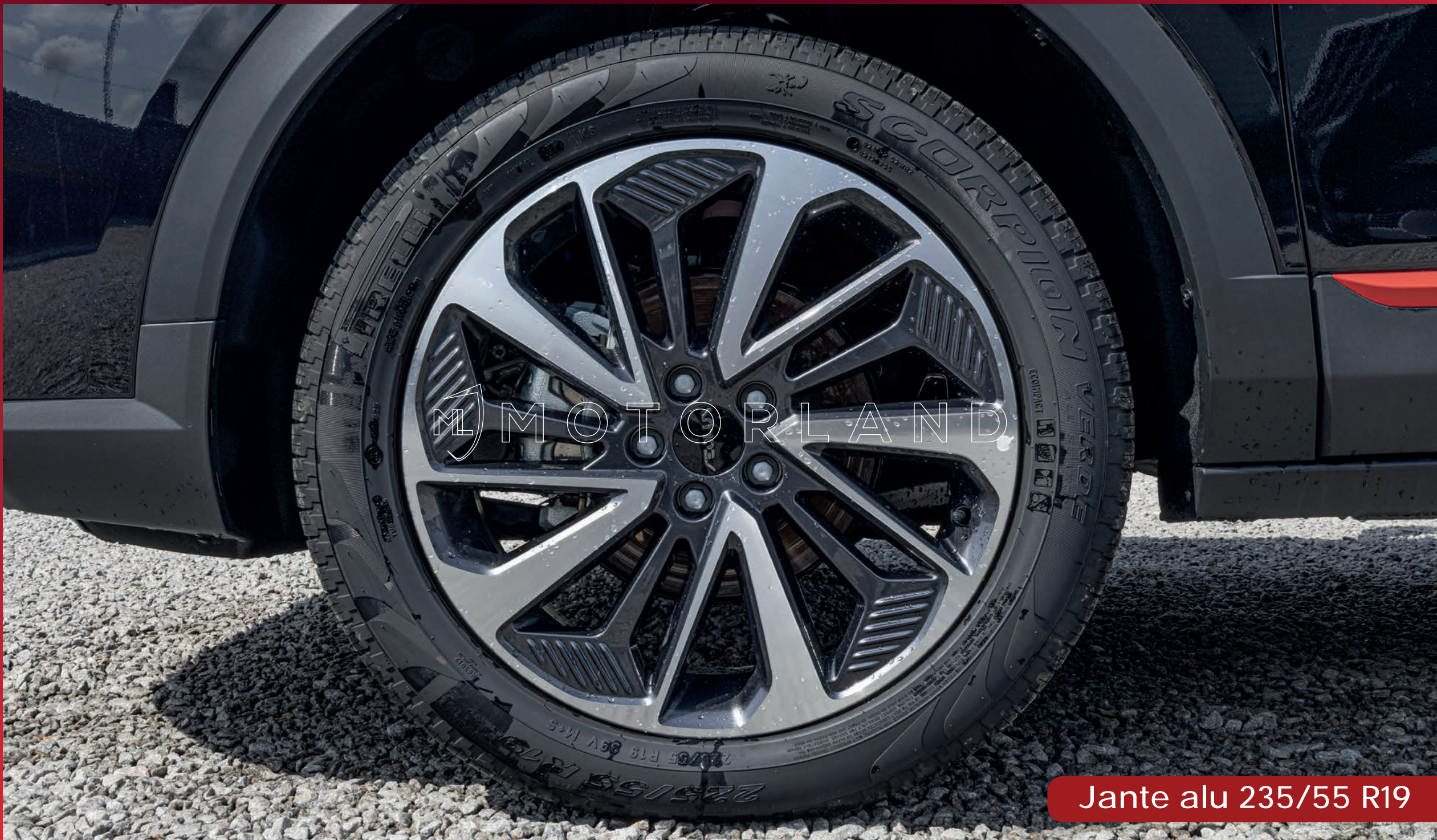
Jante alu 235/55 R19