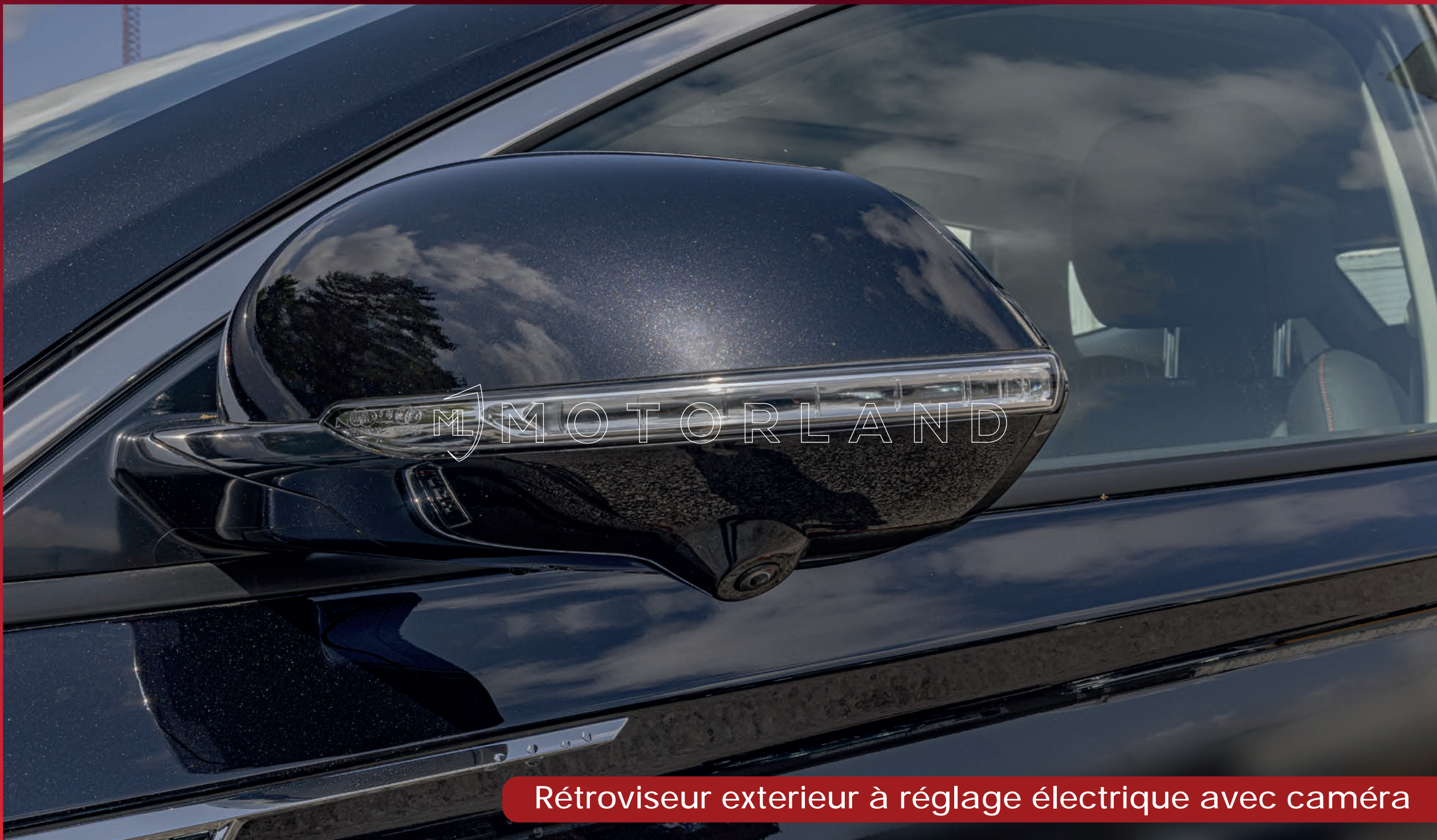
Rétroviseur extérieur à réglage électrique avec caméra