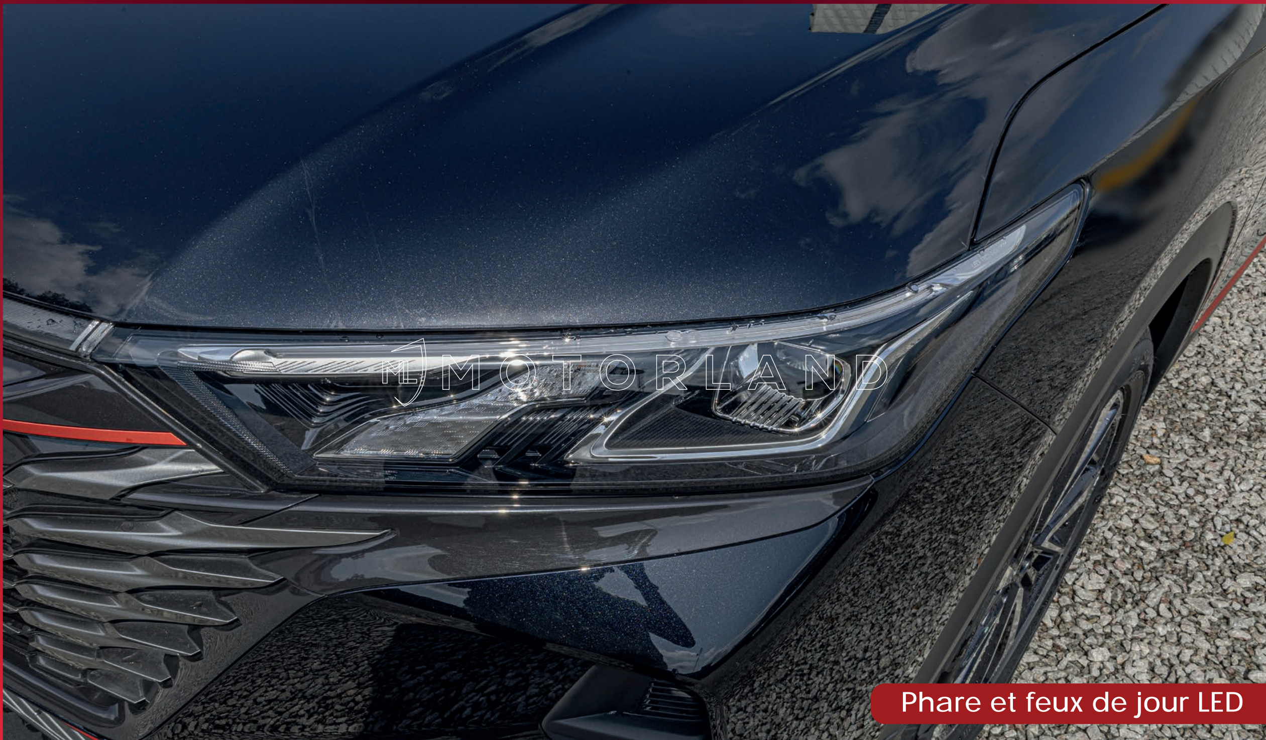
Phare et feux de jour LED