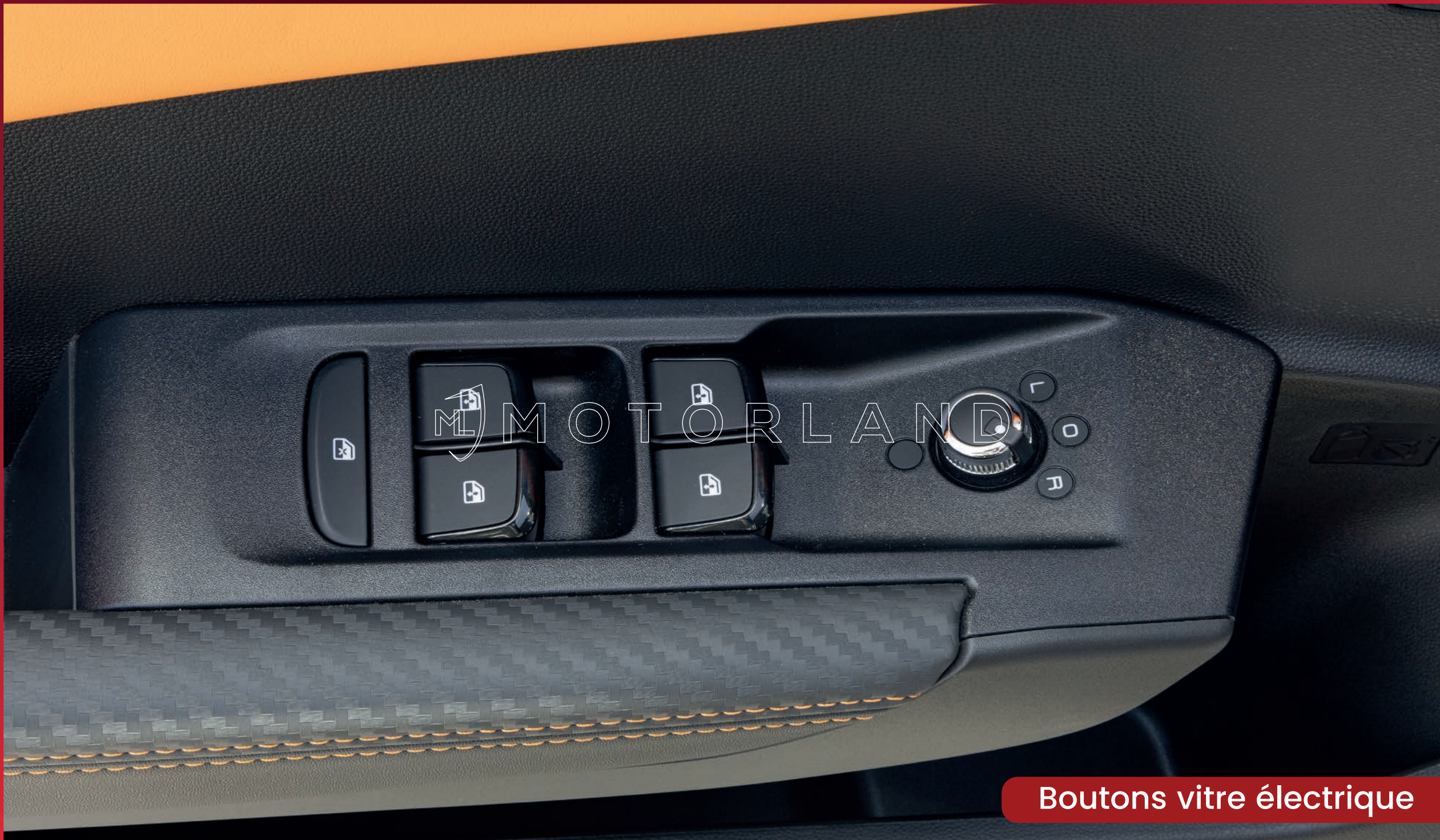
Boutons vitre électrique