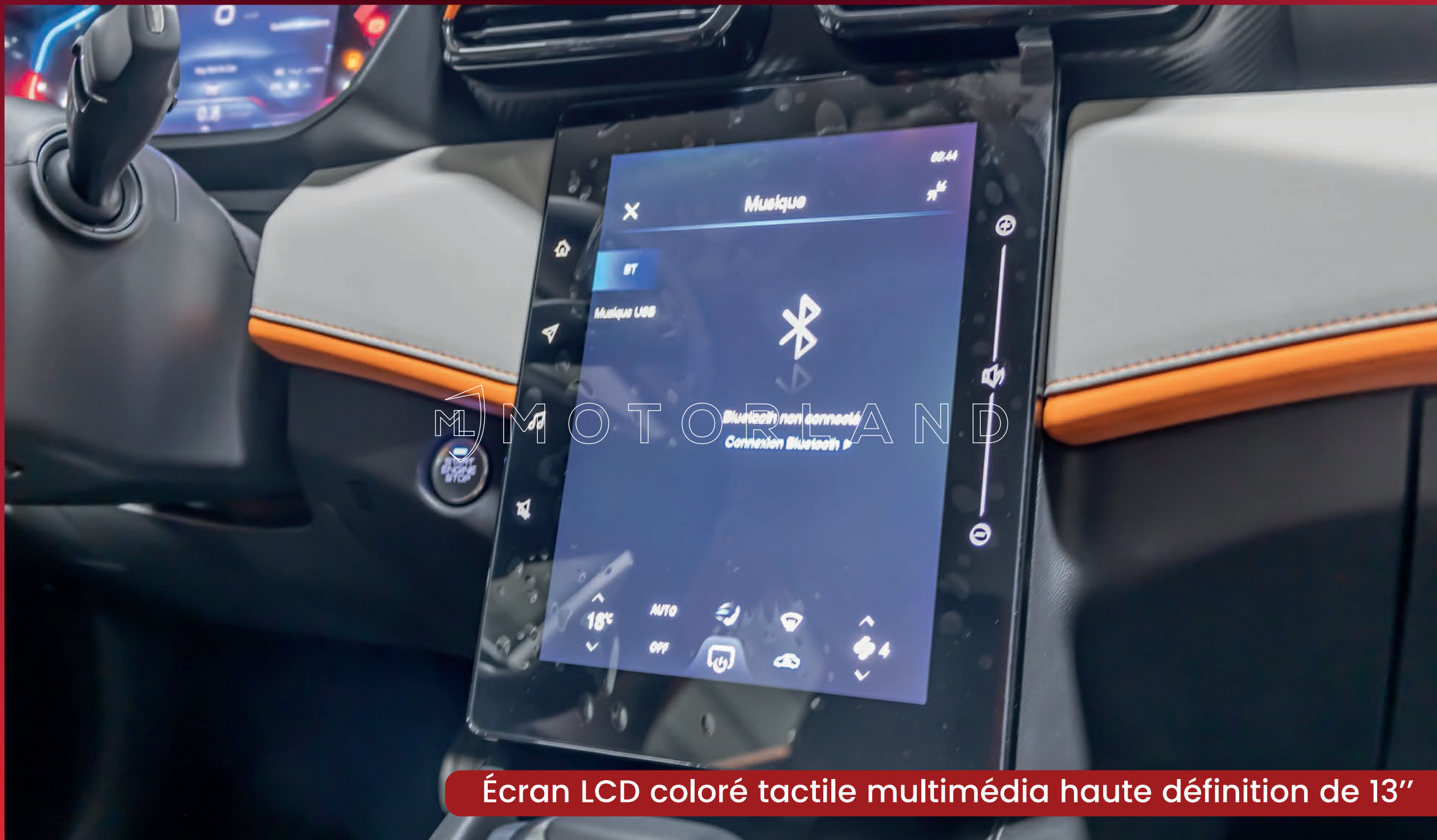
Écran LCD coloré tactile multimédia haute définition de 13"