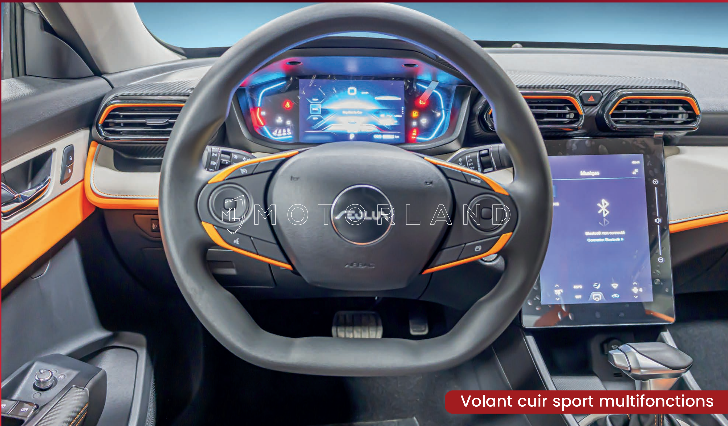
Volant cuir sport multifonctions