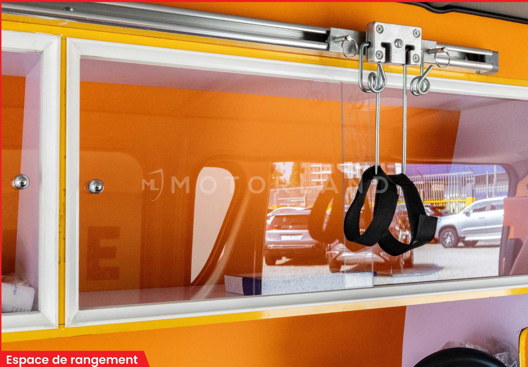
Espace de rangement