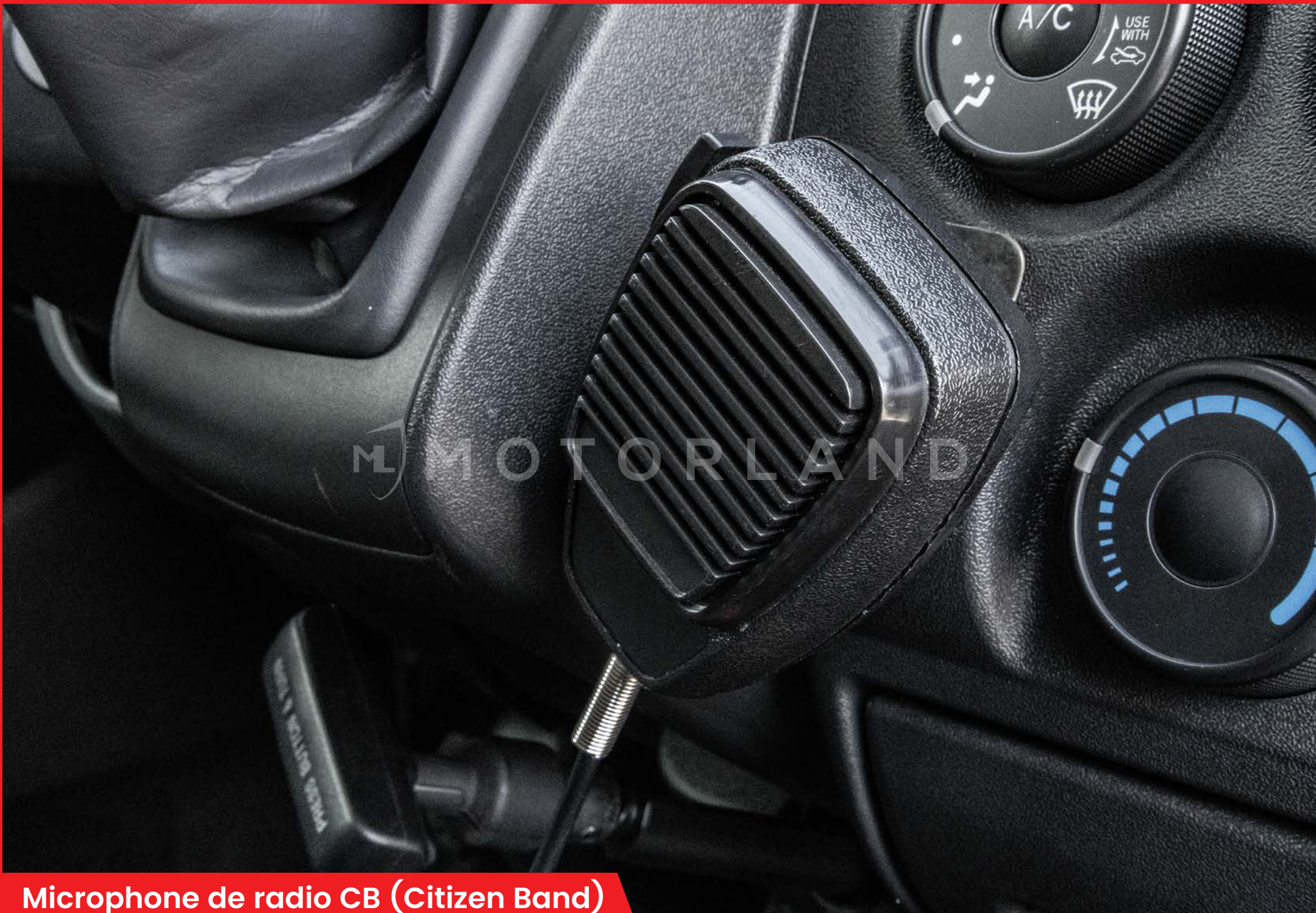
Microphone de radio CB (Citizen Band)