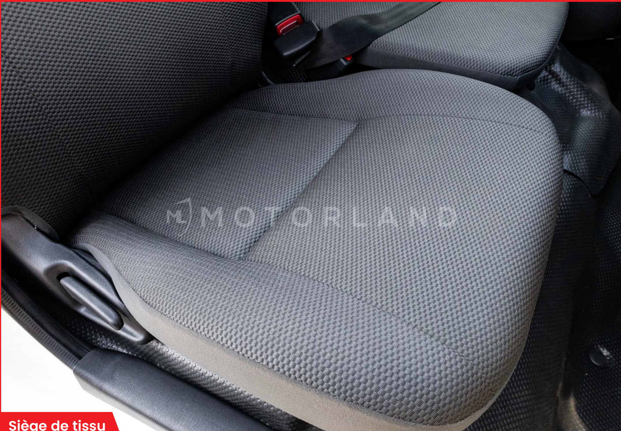
Siège de tissu