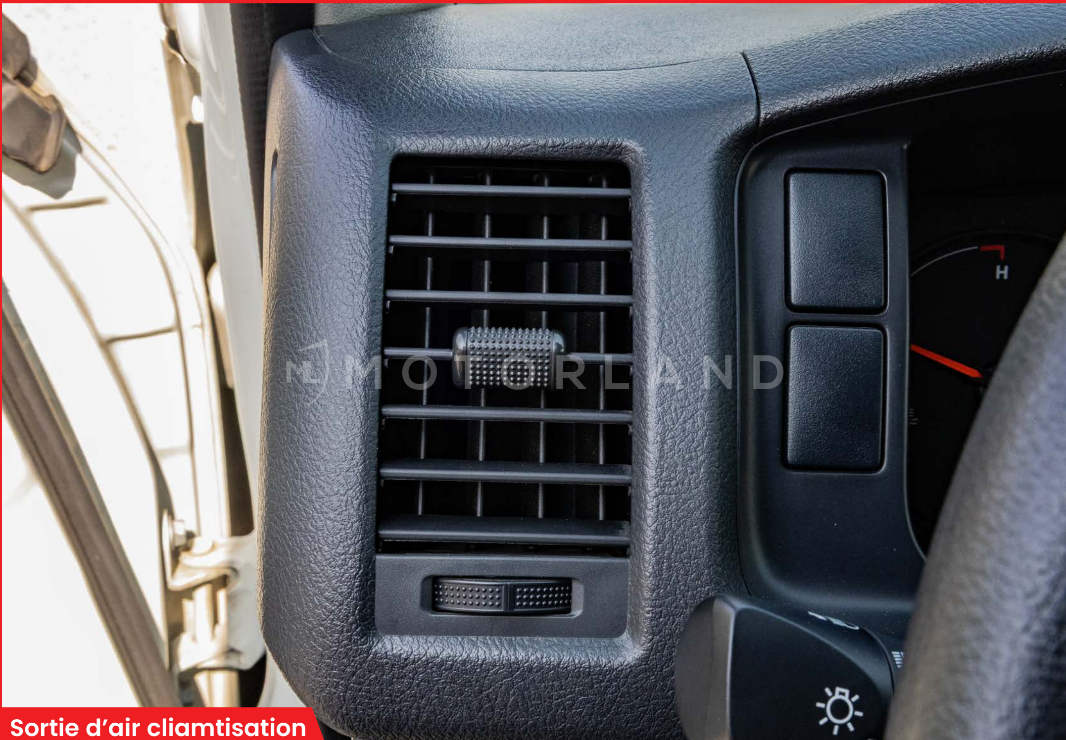
Sortie d'air cliamtisation