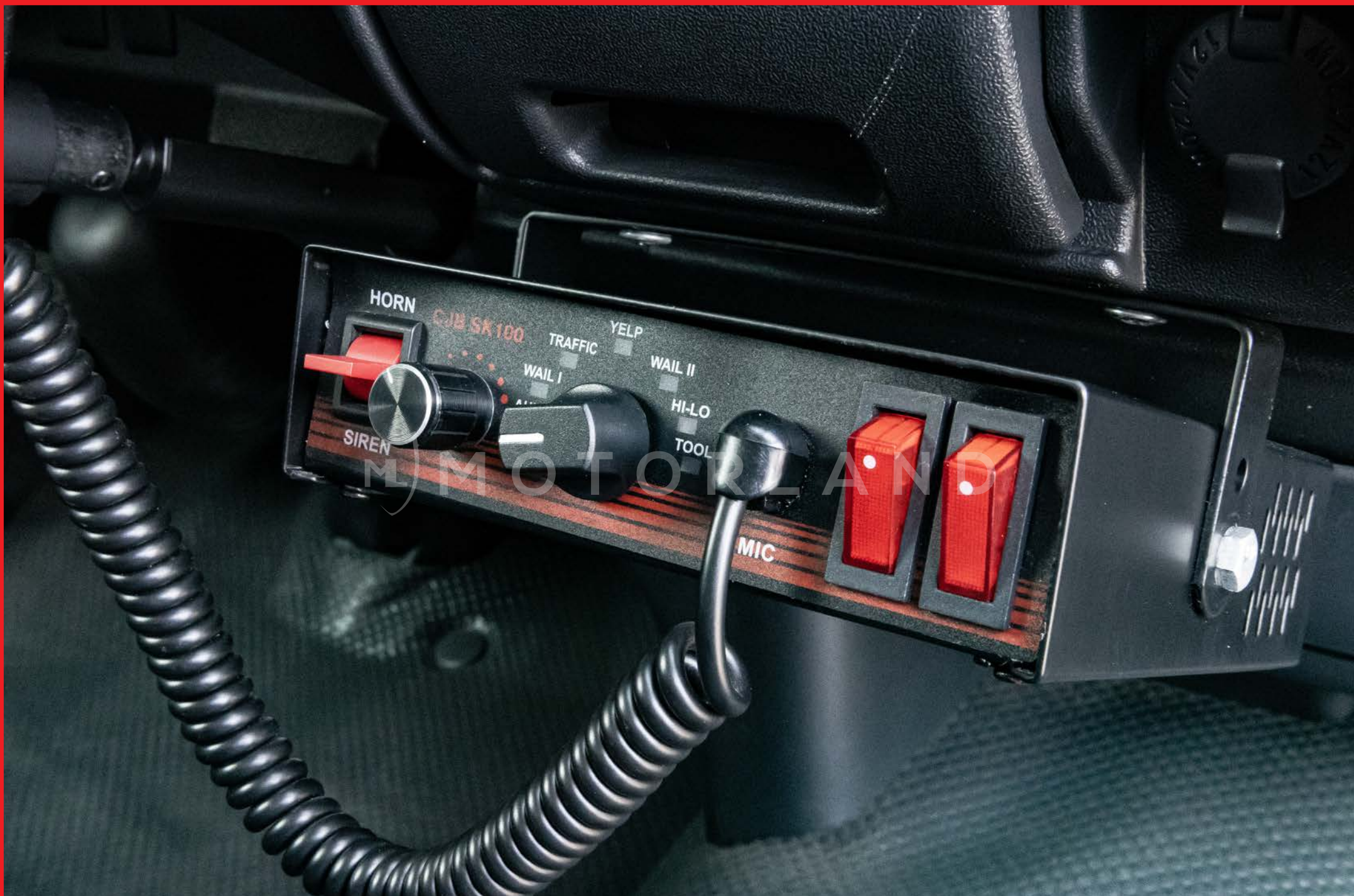
Contrôleur de sirène et de klaxon d'urgence