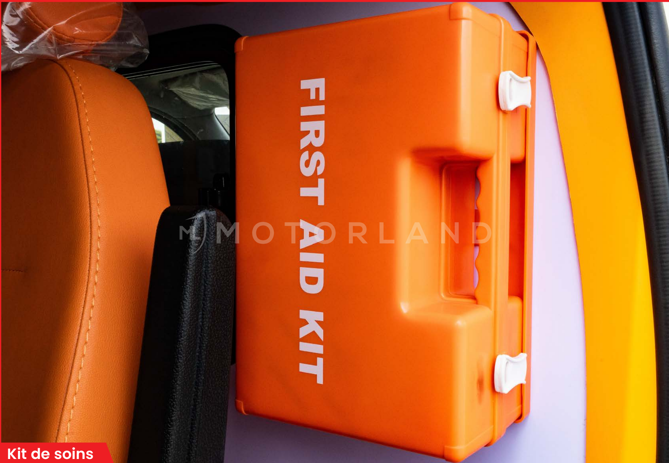
Kit de soins