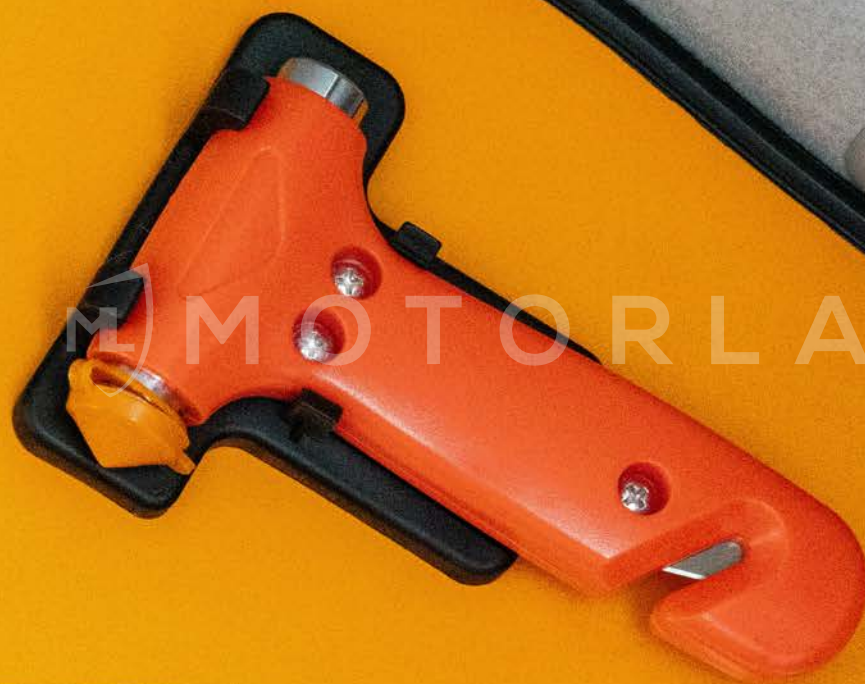
Marteau d'évacuation d'urgence