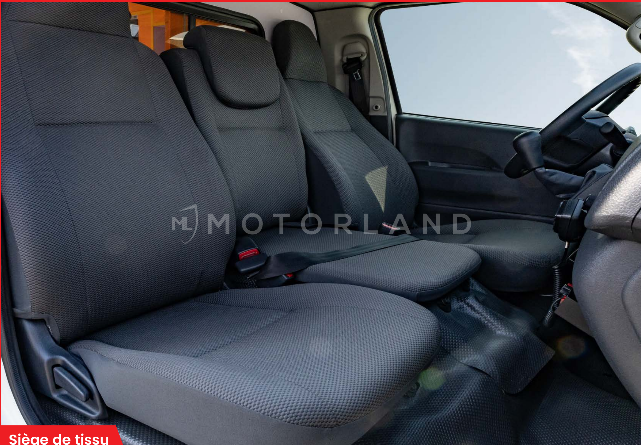
Siège de tissu