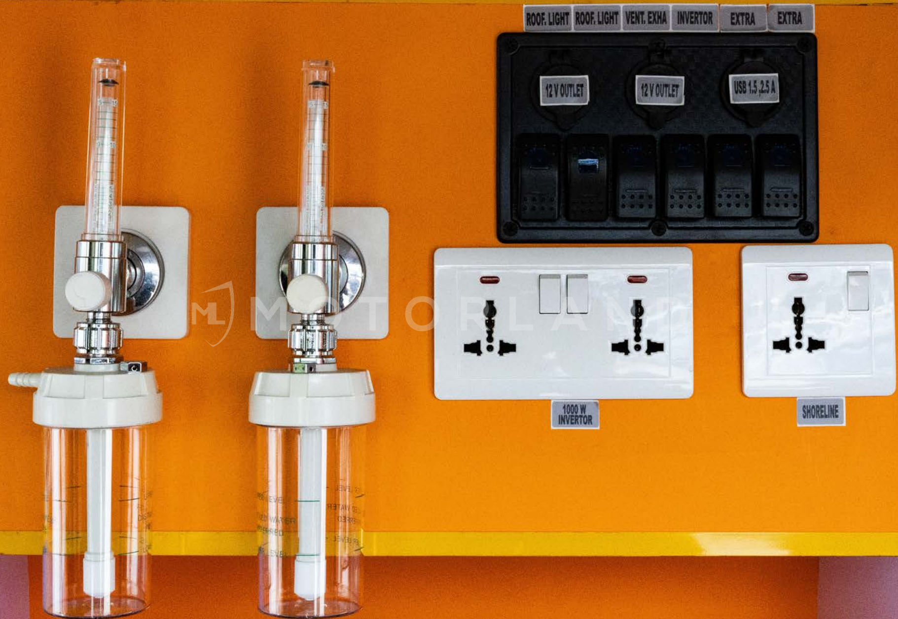
Débitmètres d'oxygène médicaux avec humidificateurs + Prises électriques