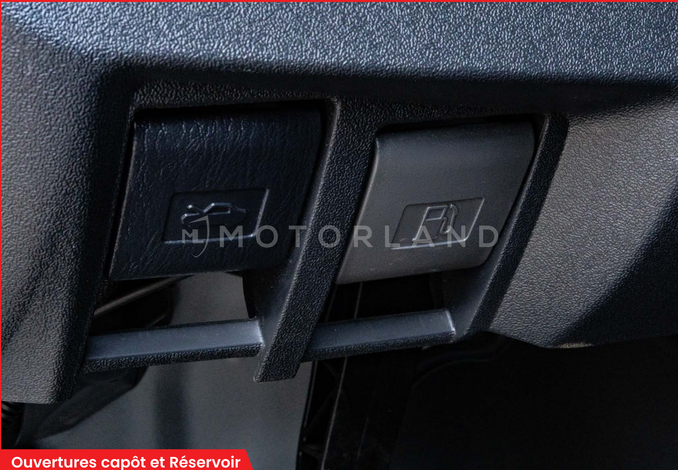
Ouvertures capôt et Réservoir