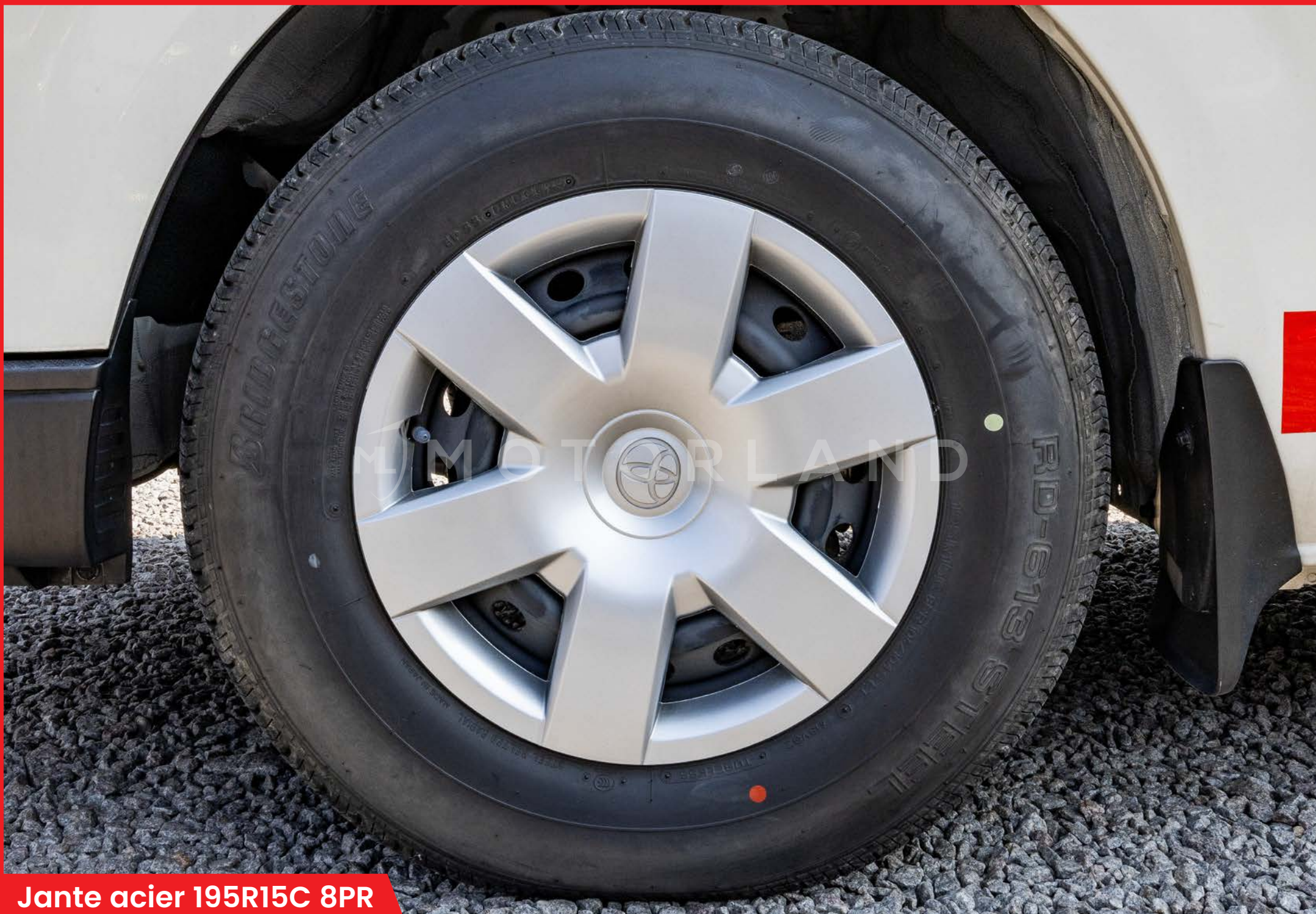
Jante acier 195R15C 8PR