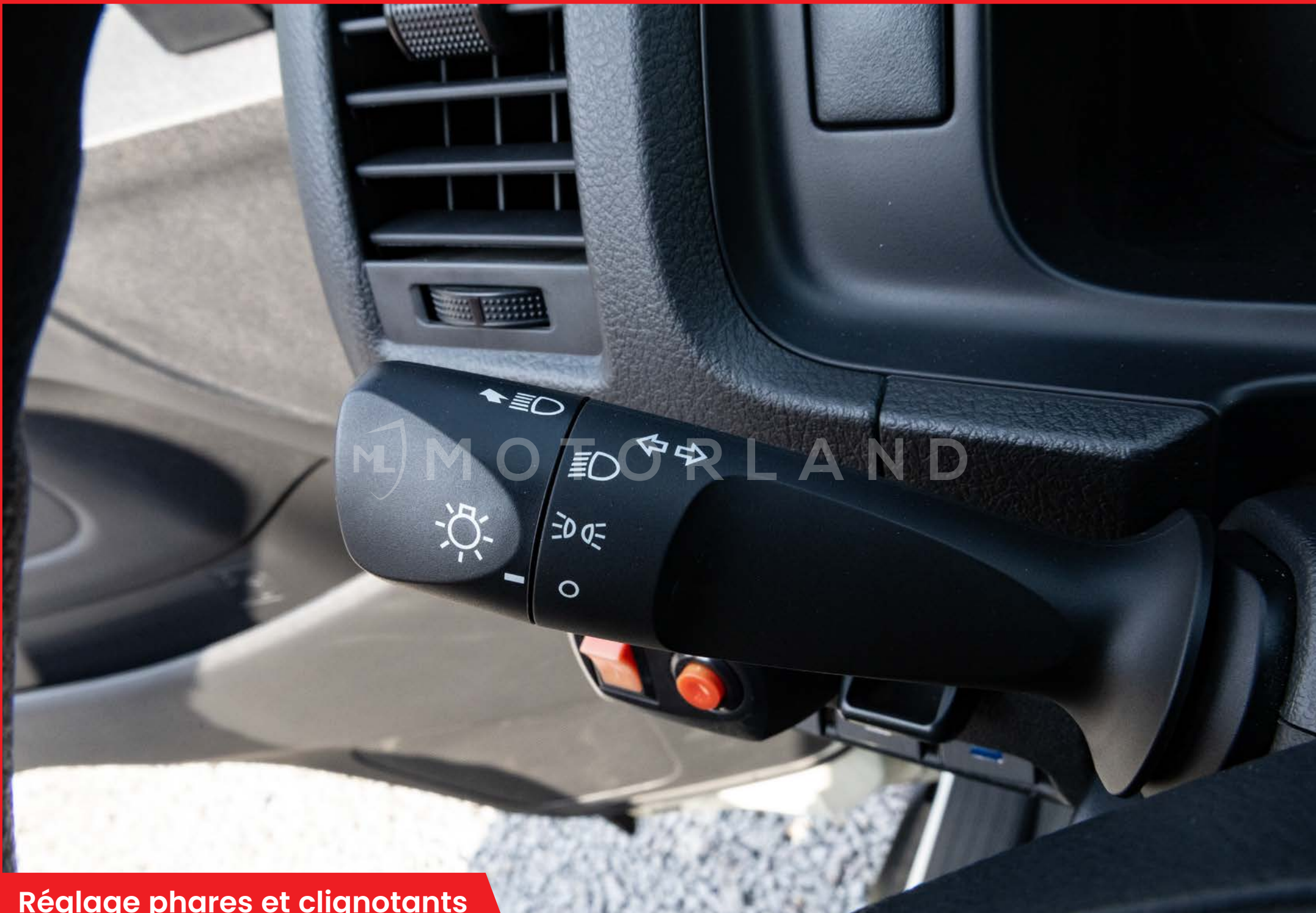
Réglage phares et clignotants