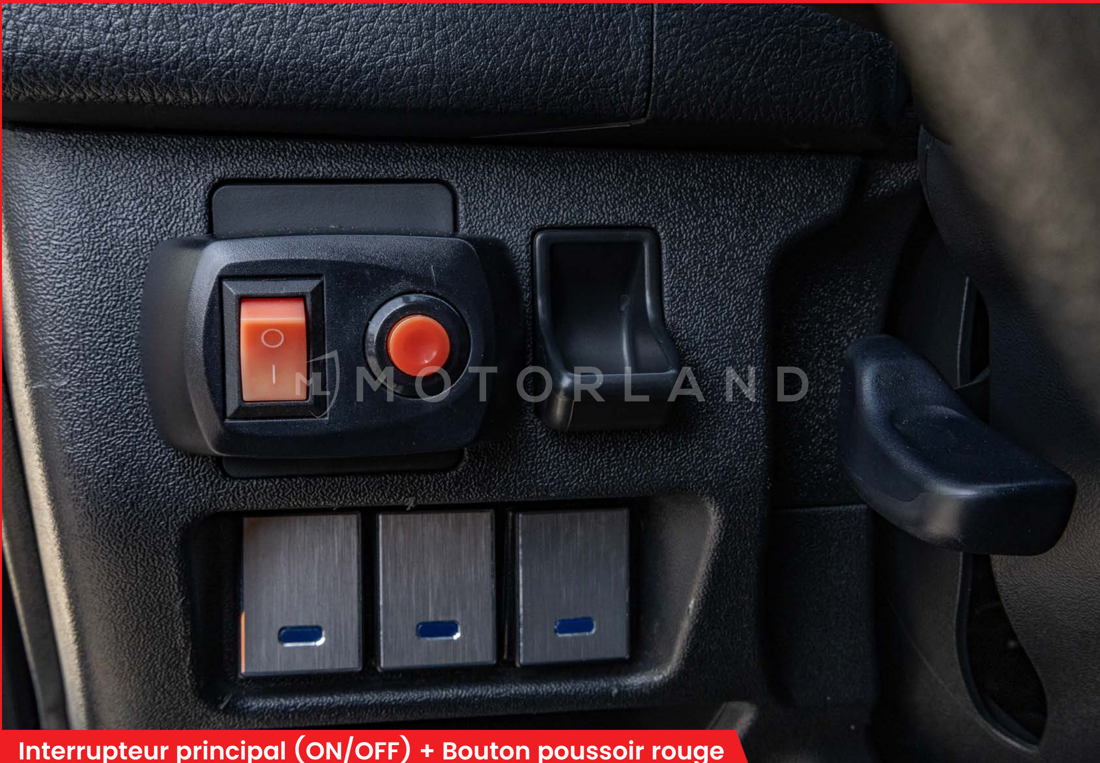
Interrupteur principal (ON/OFF) + Bouton poussoir rouge