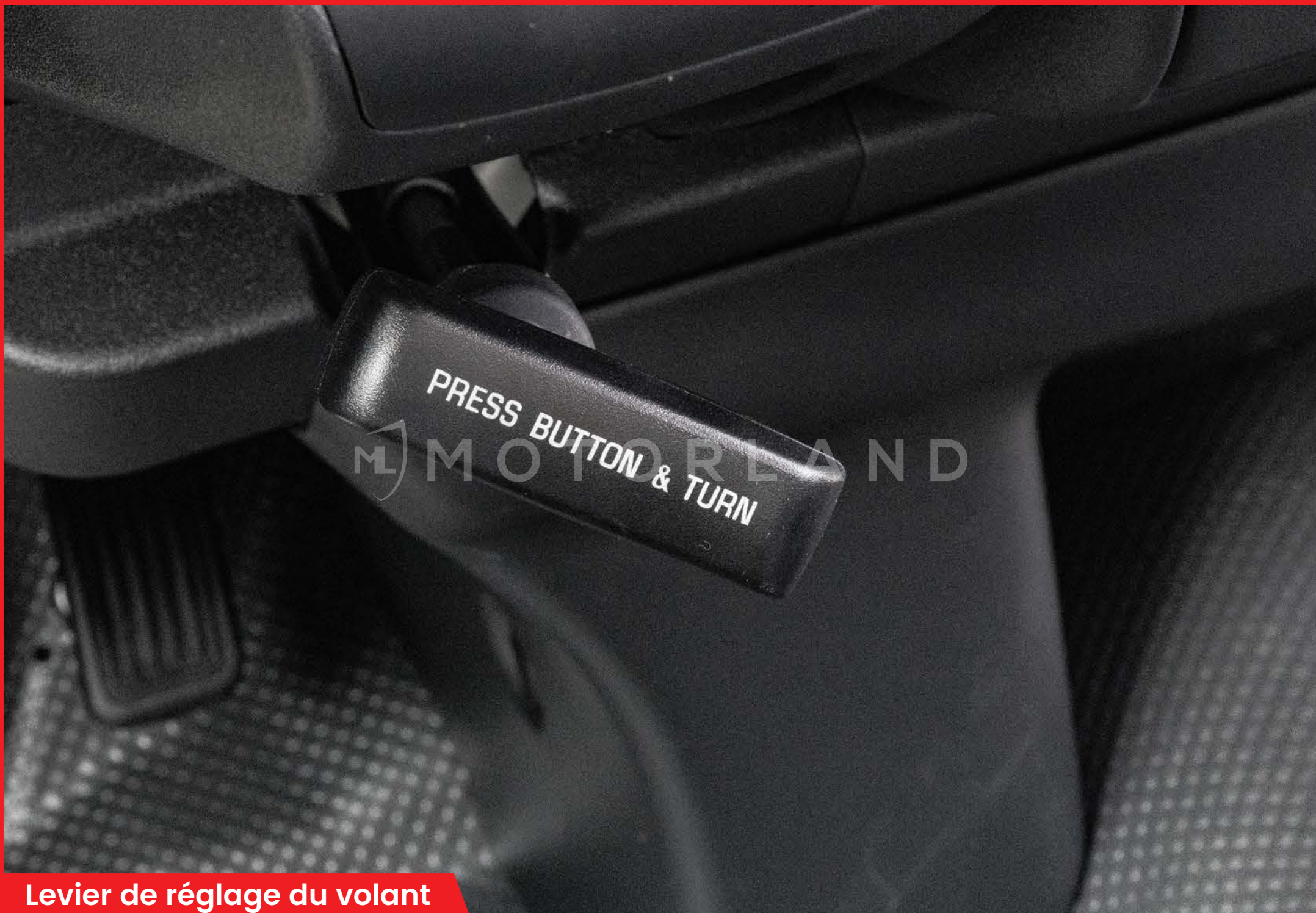
Levier de réglage du volant