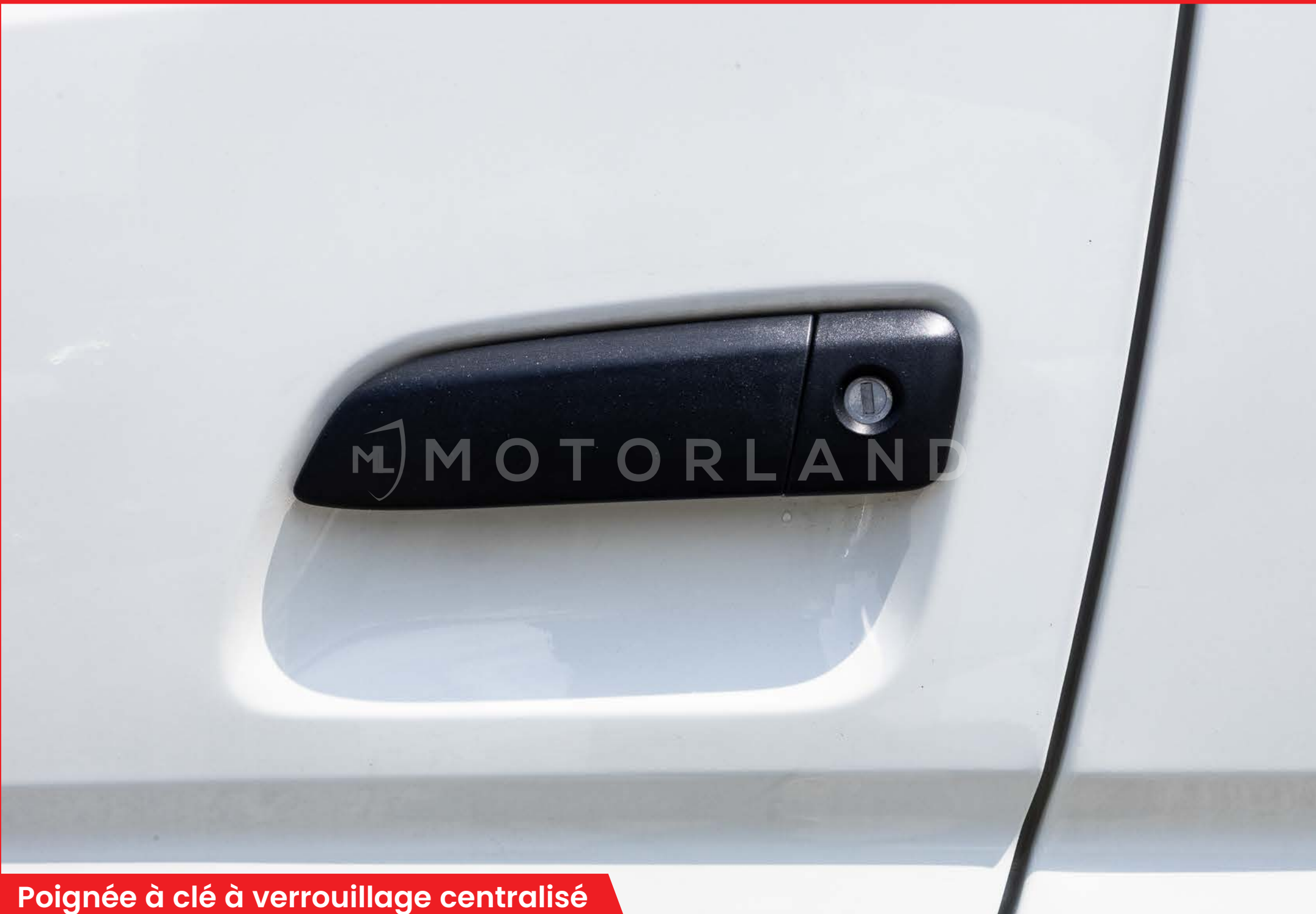
Poignée à clé à verrouillage centralisé