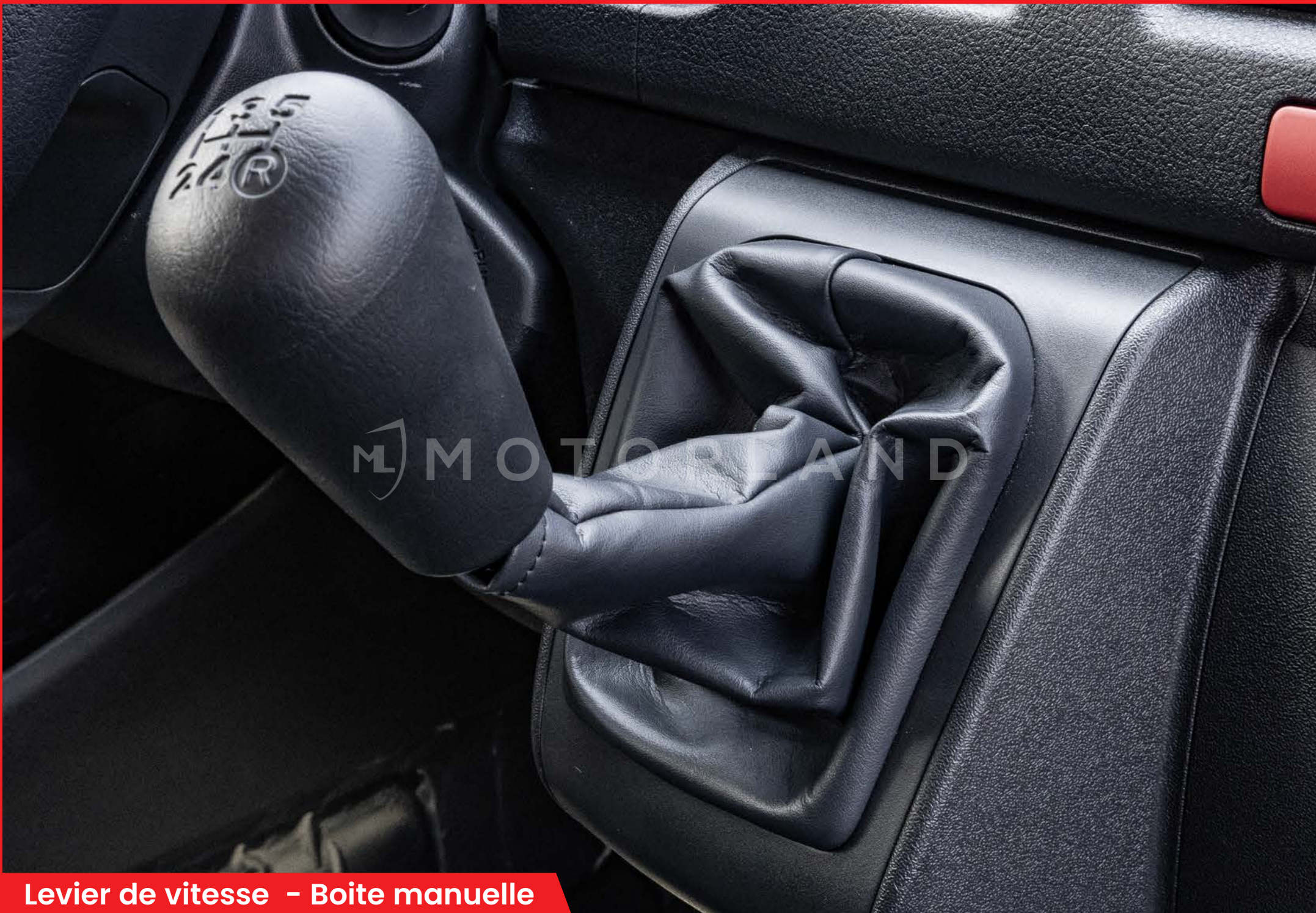
Levier de vitesse – Boite manuelle