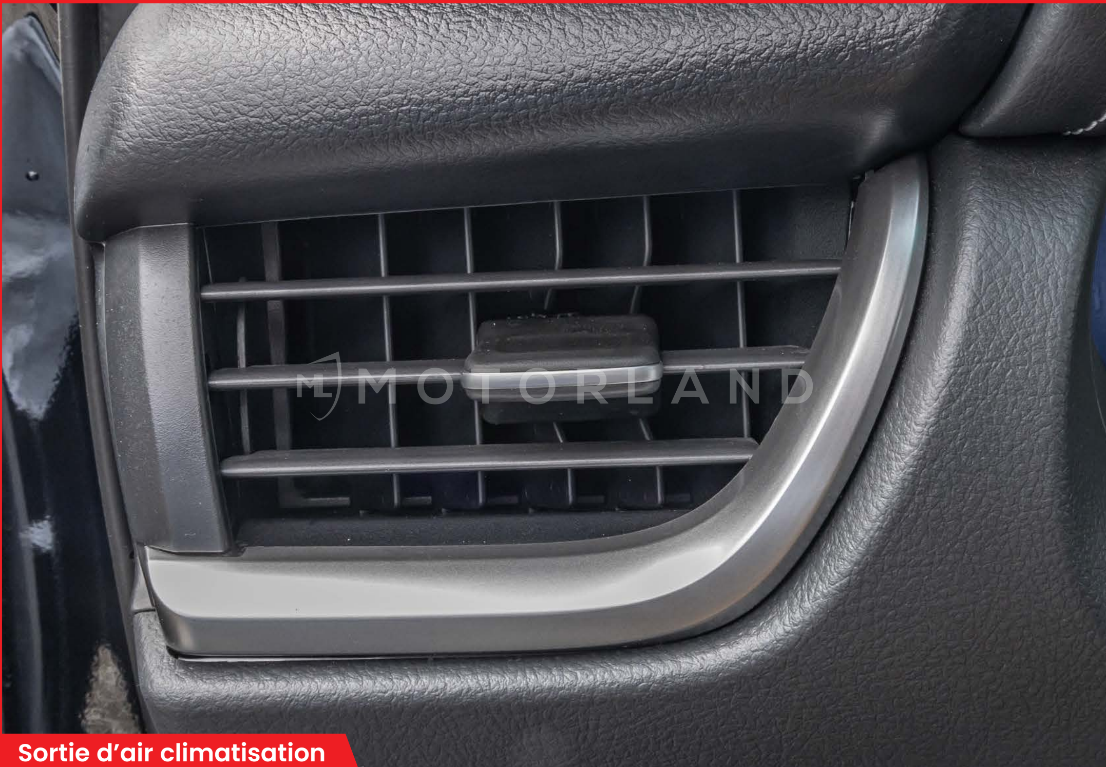
Sortie d'air climatisation