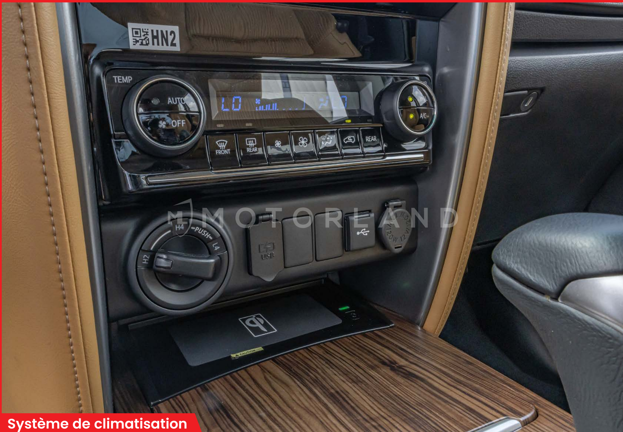
Système de climatisation