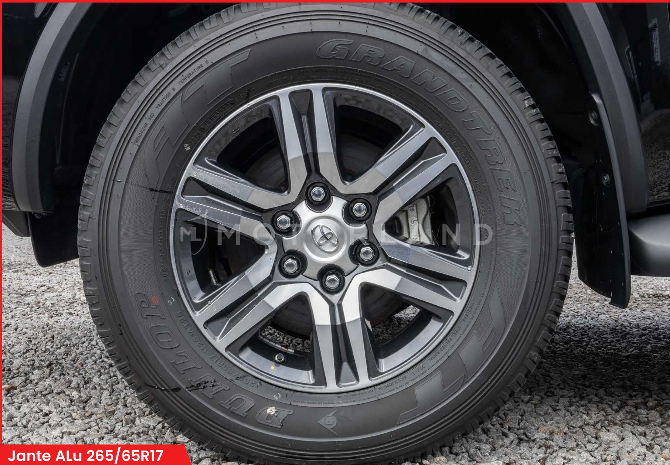
Jante ALu 265/65R17