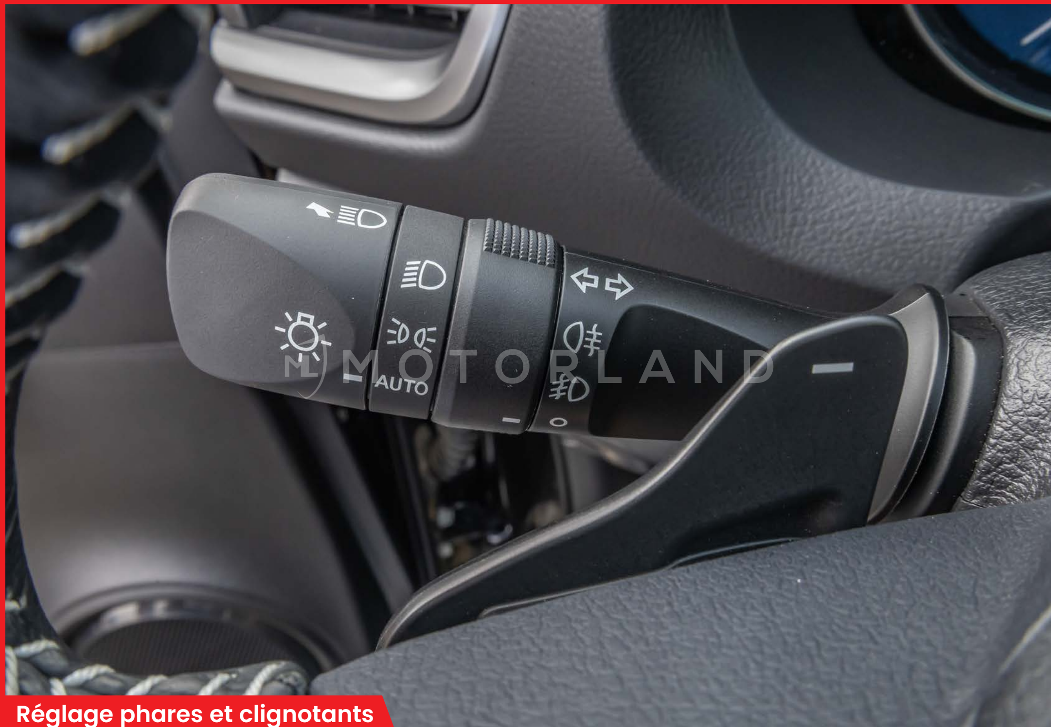
Réglage phares et clignotants