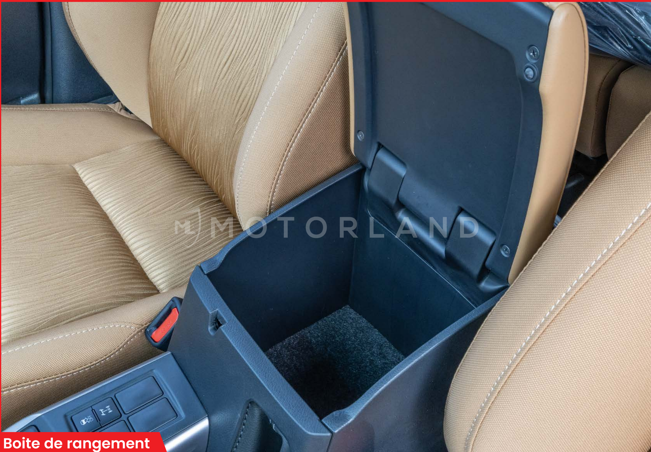
Boîte de rangement