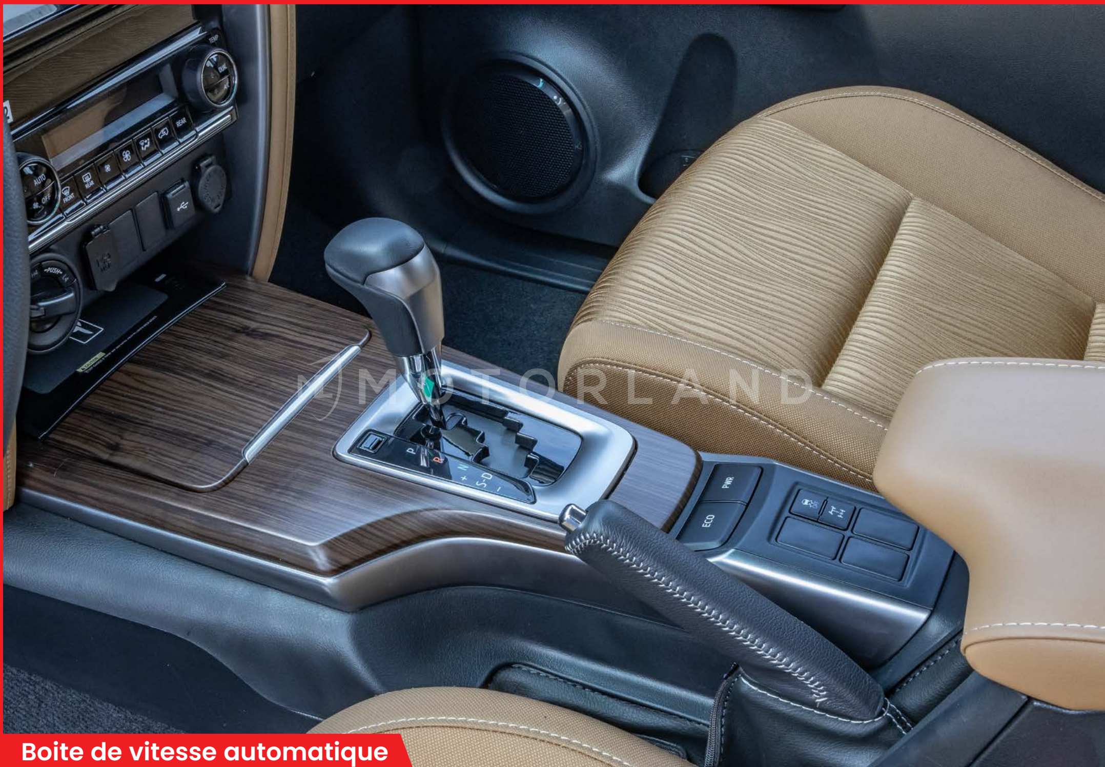
Boite de vitesse automatique