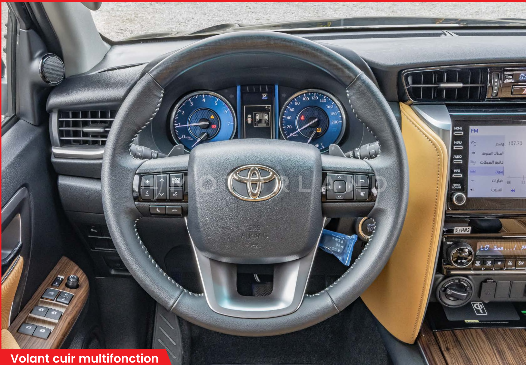
Volant cuir multifonction