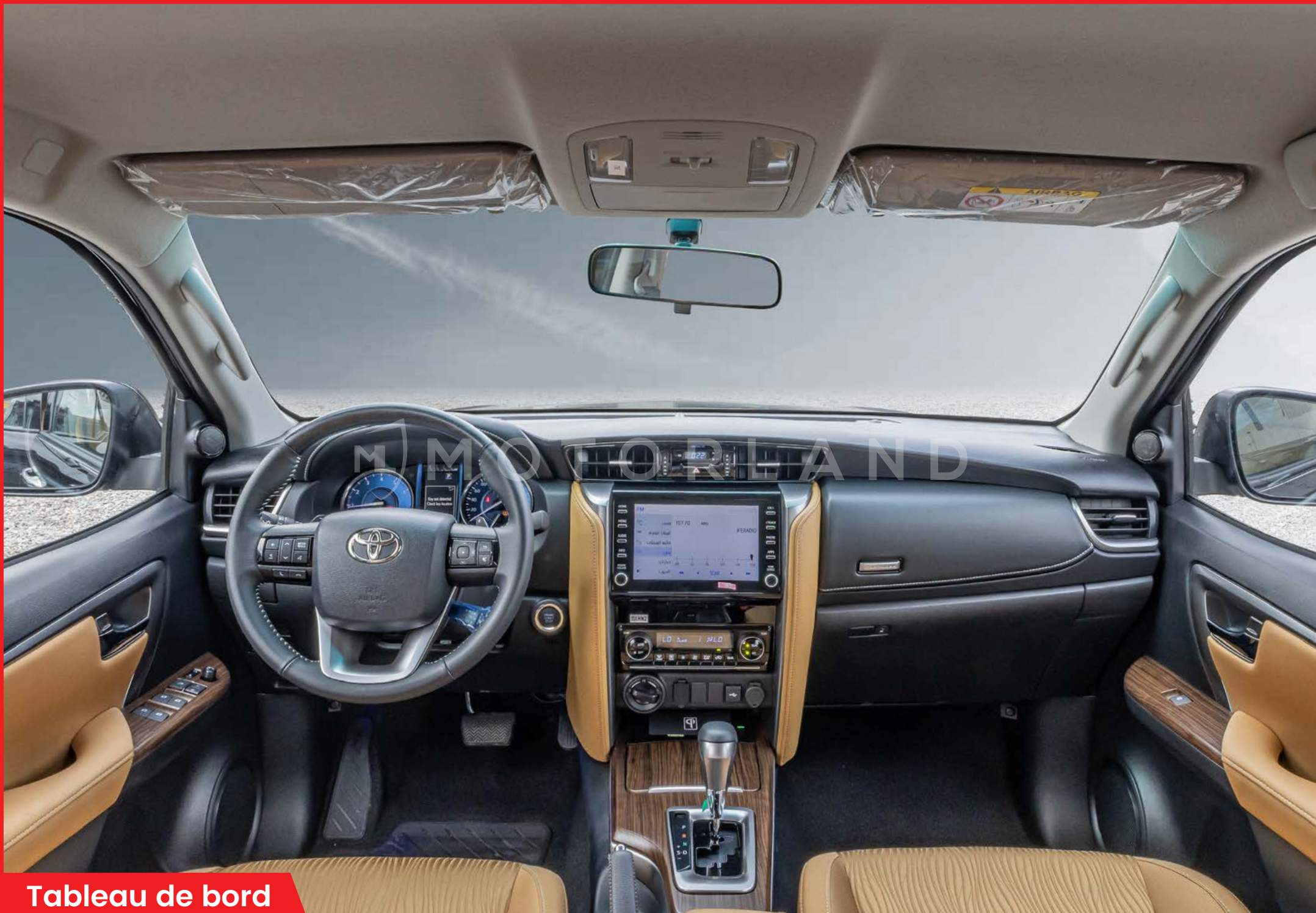
Tableau de bord