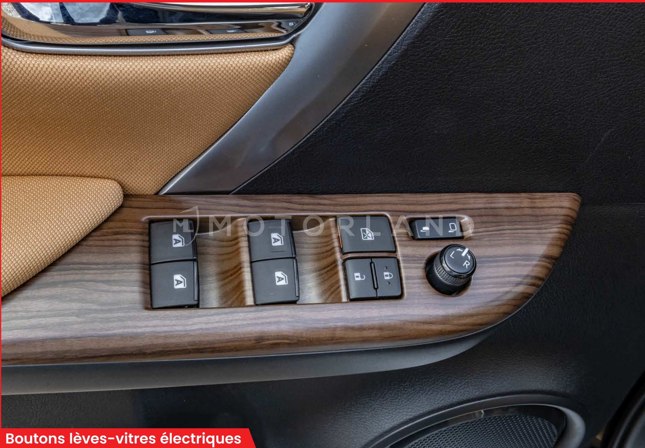
Boutons lèves-vitres électriques