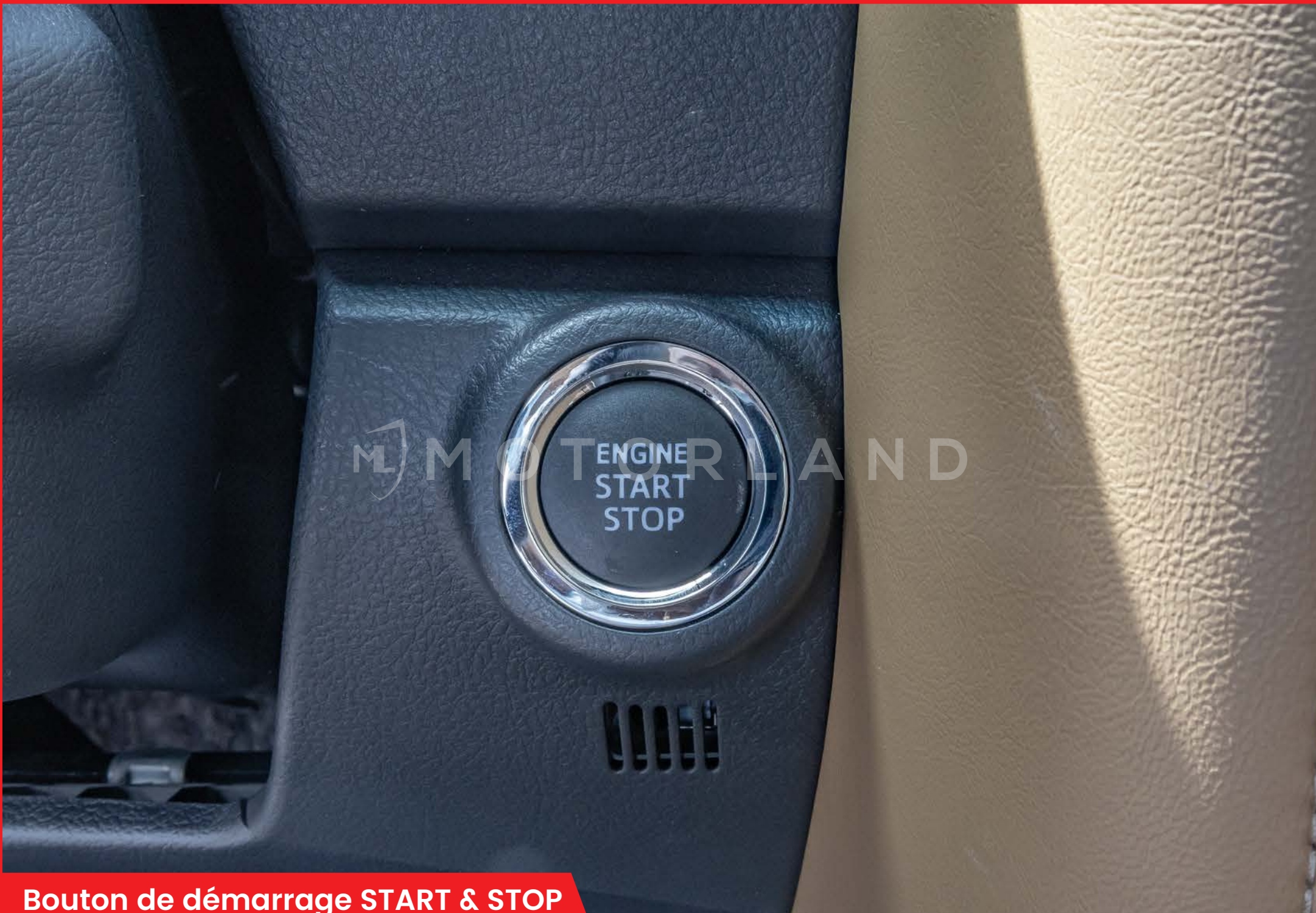
Bouton de démarrage START & STOP