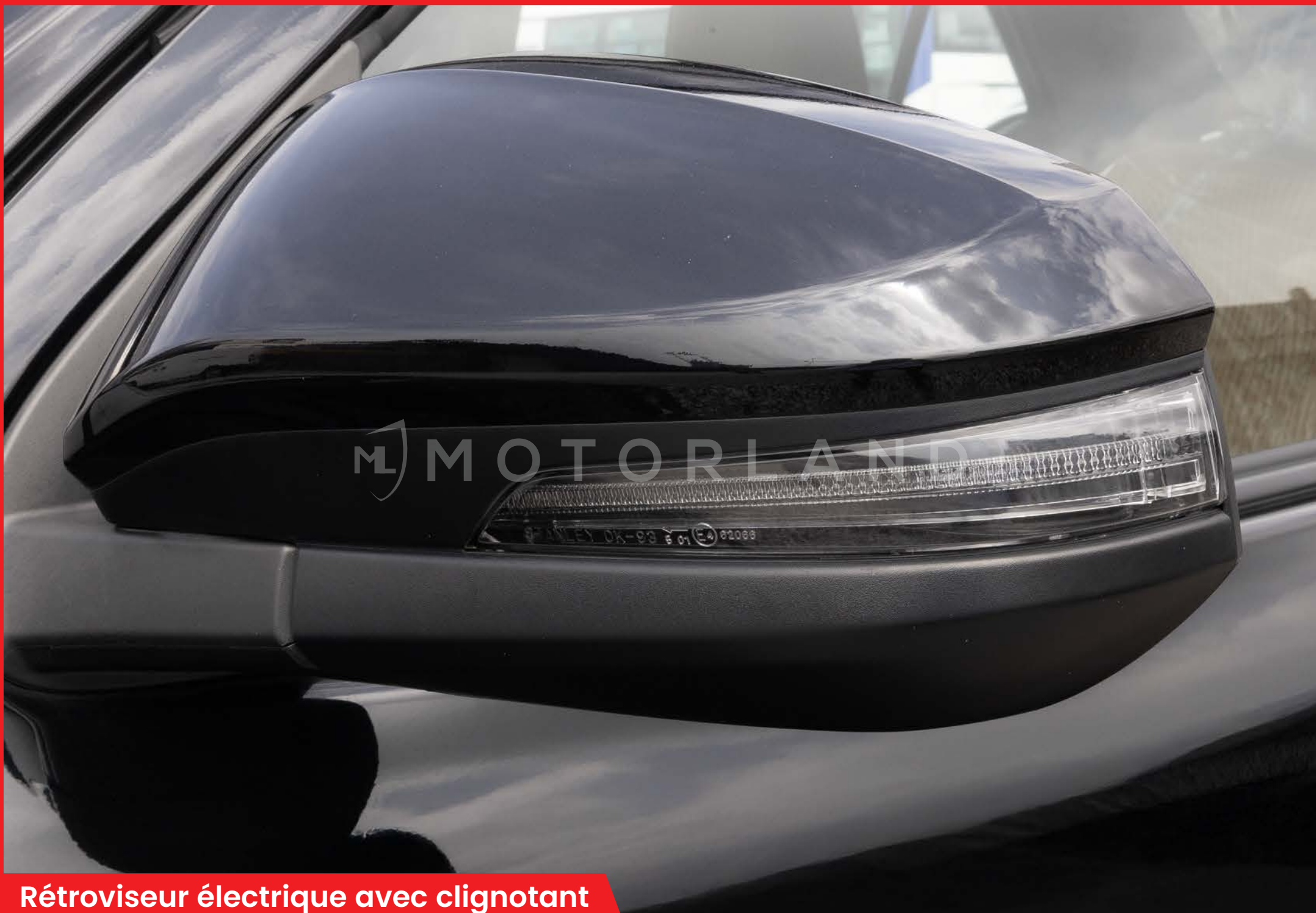
Rétroviseur électrique avec clignotant