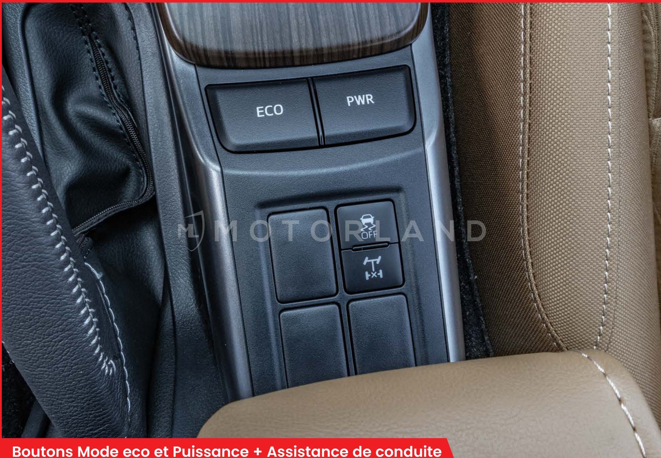
Boutons Mode eco et Puissance + Assistance de conduite