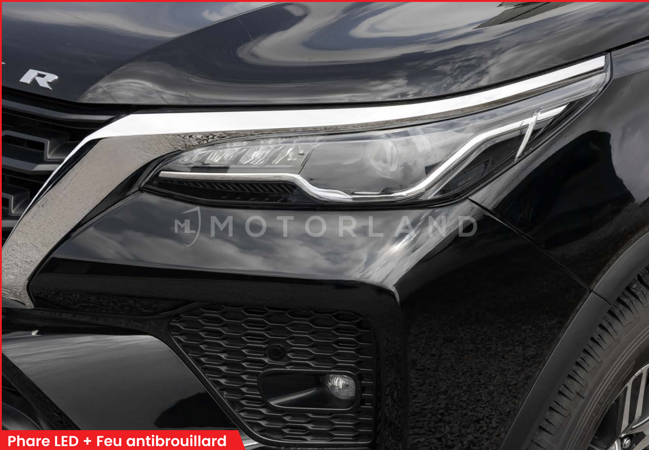
Phare LED + Feu antibrouillard