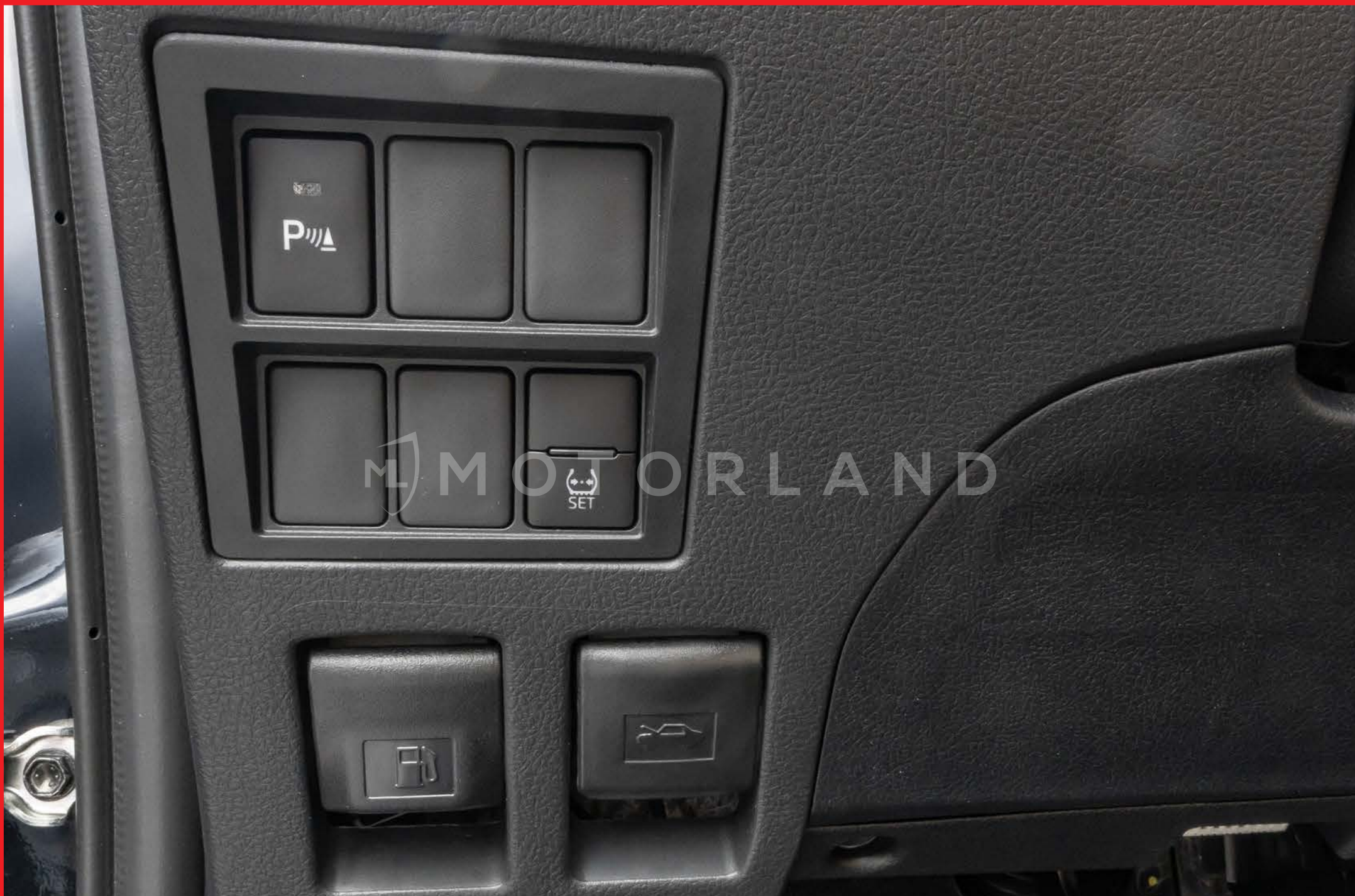
Boutons d'ouvertures réservoir et capôt + bouton capteurs de stationnement