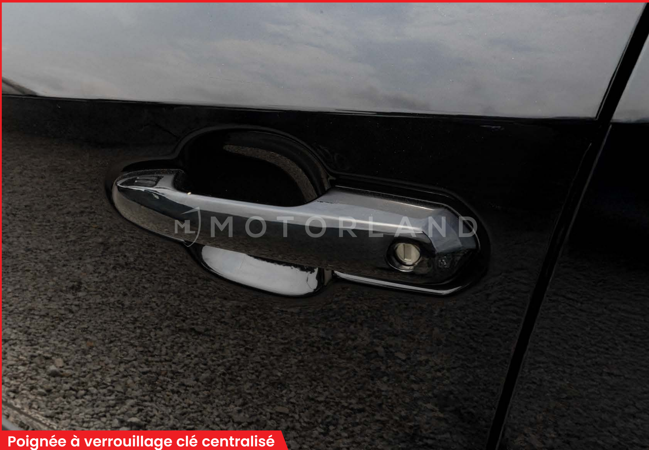
Poignée à verrouillage clé centralisé