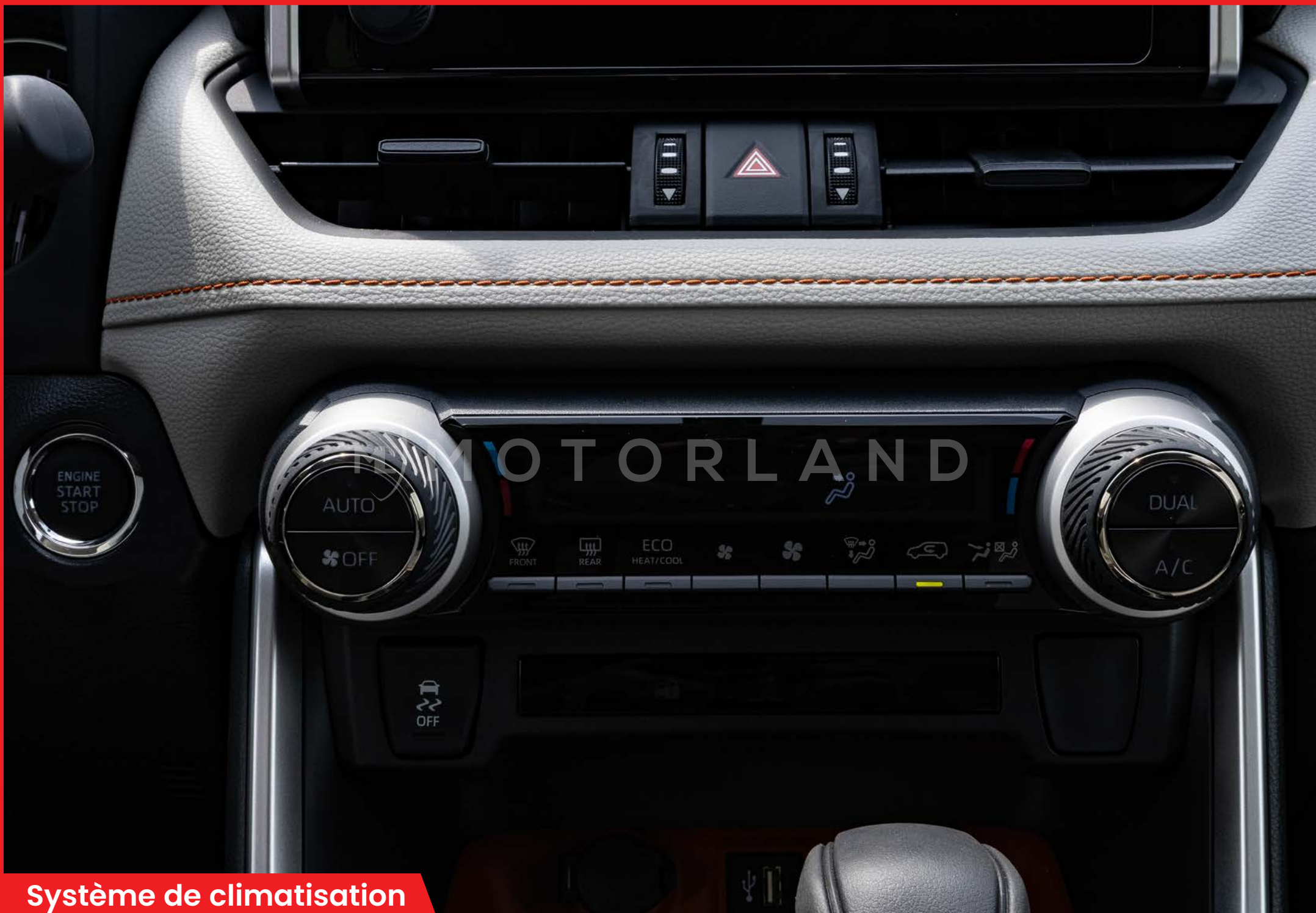
Système de climatisation