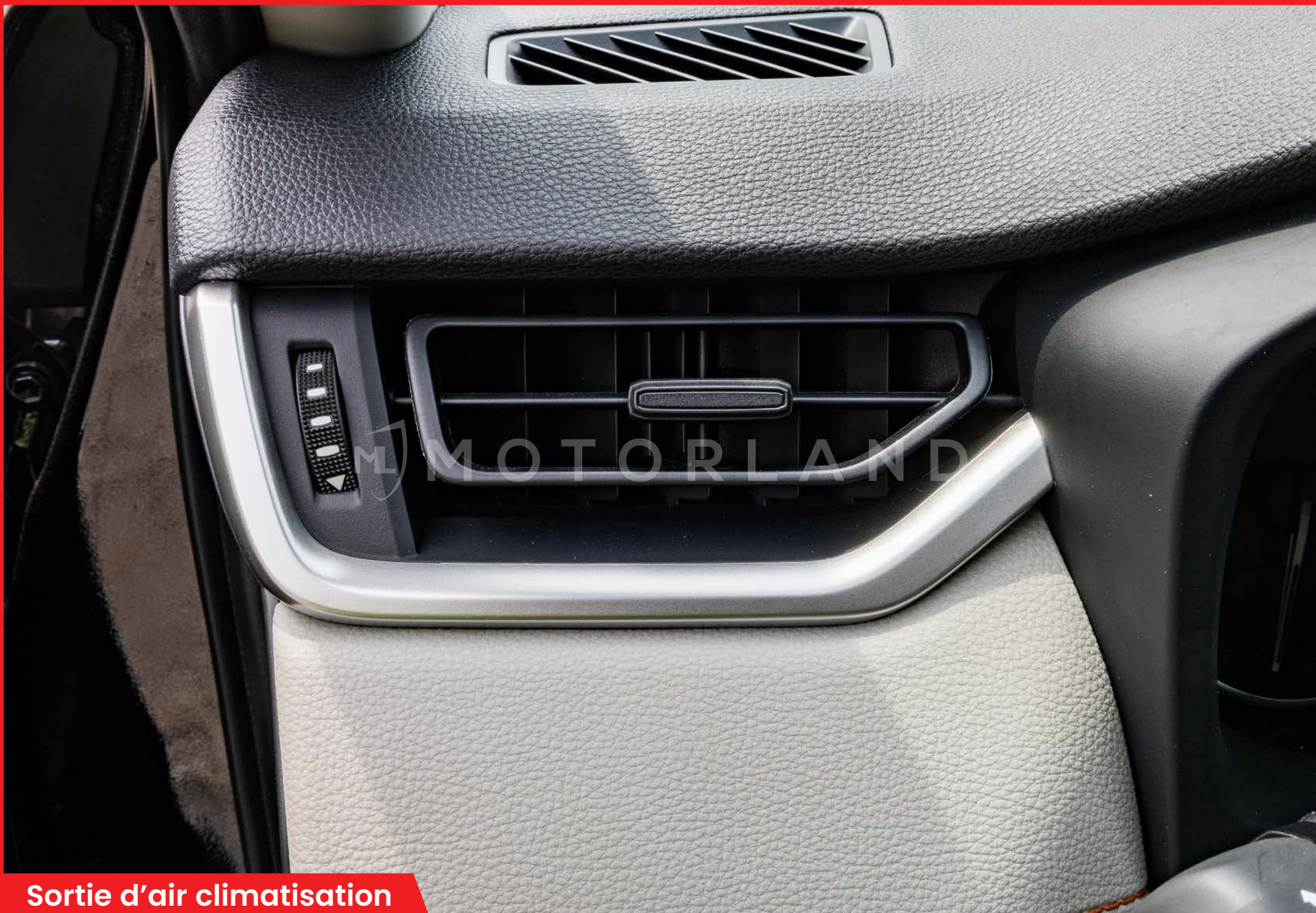
Sortie d'air climatisation