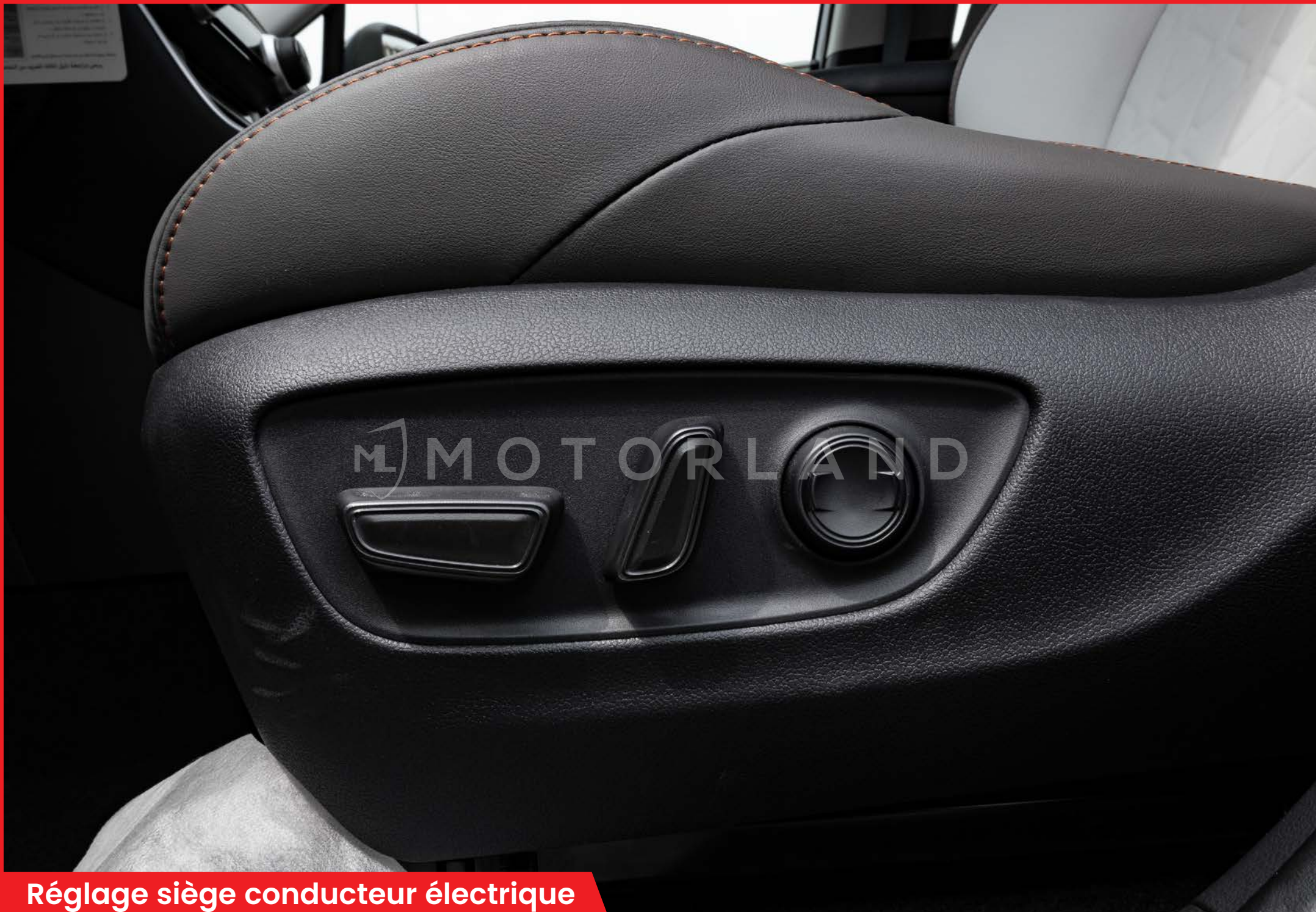
Réglage siège conducteur électrique