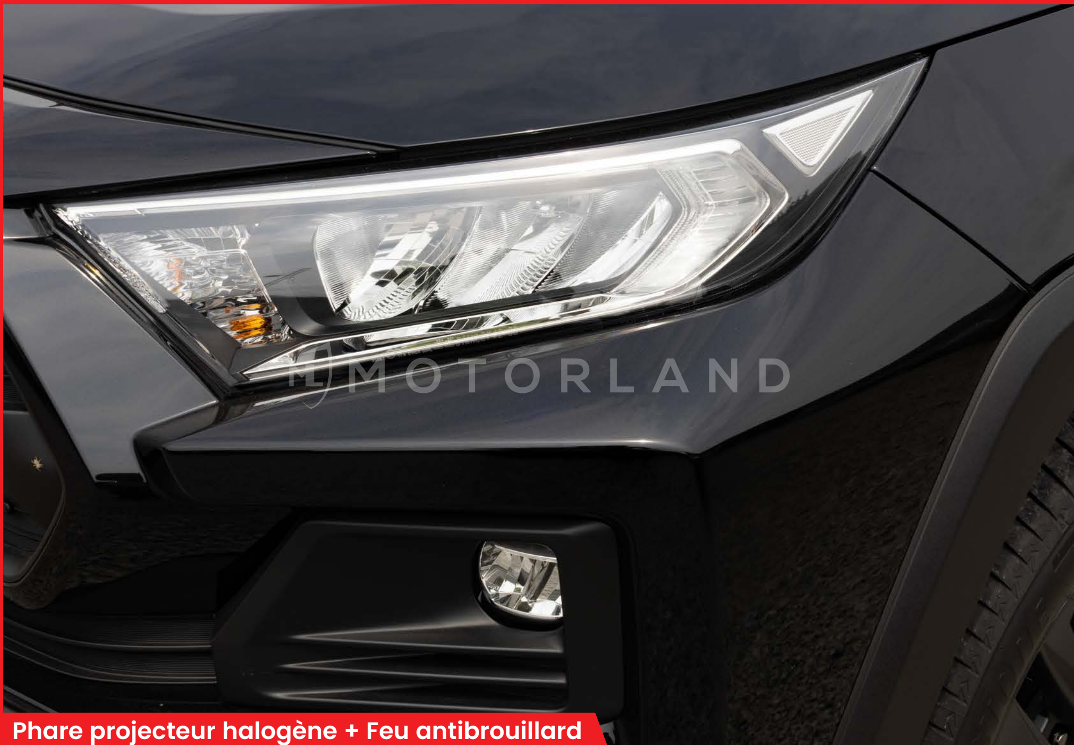
Phare projecteur halogène + Feu antibrouillard