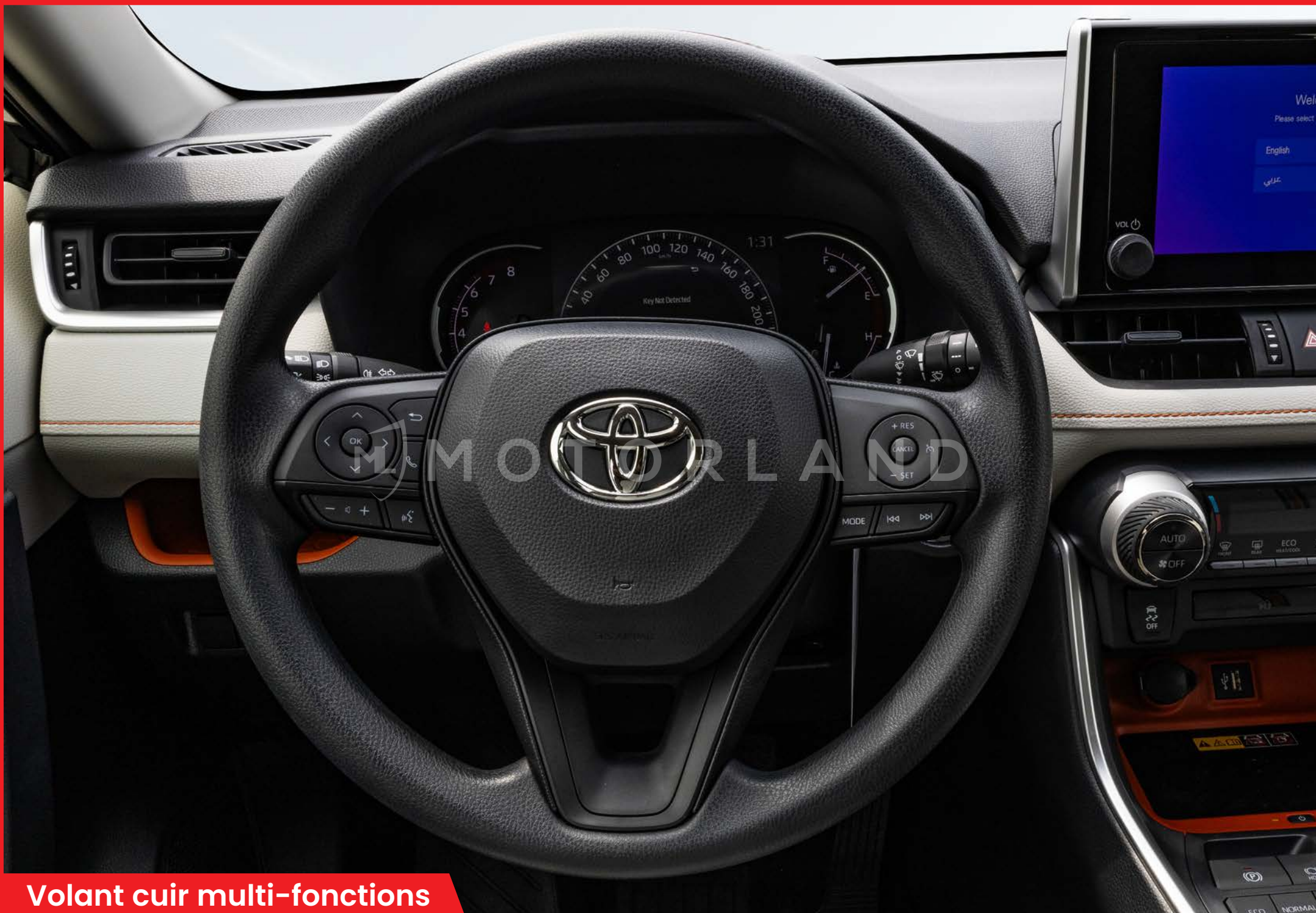
Volant cuir multi-fonctions