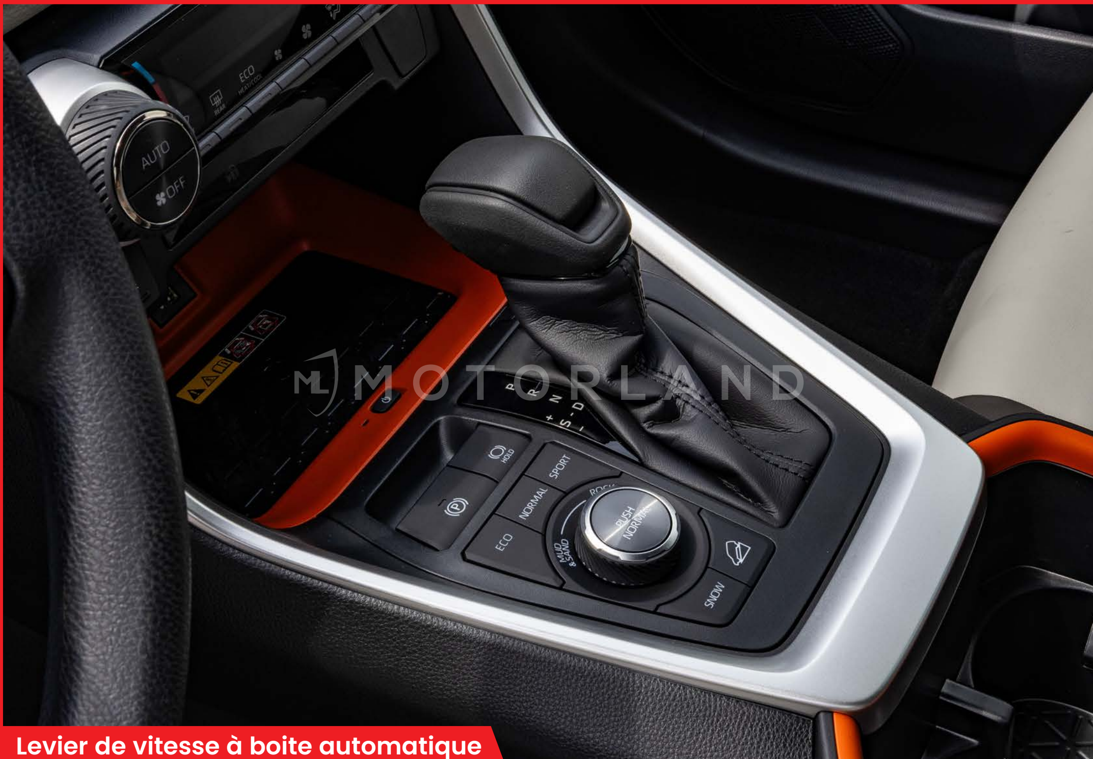
Levier de vitesse à boîte automatique