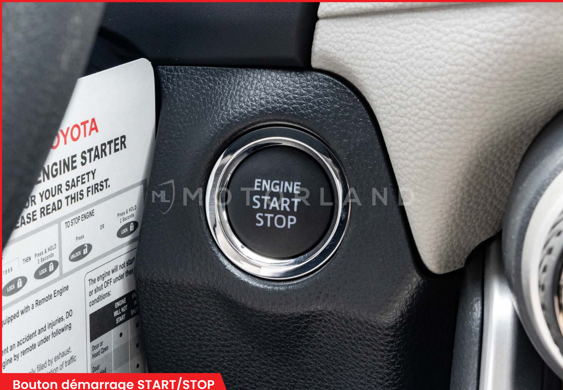
Bouton démarrage START/STOP