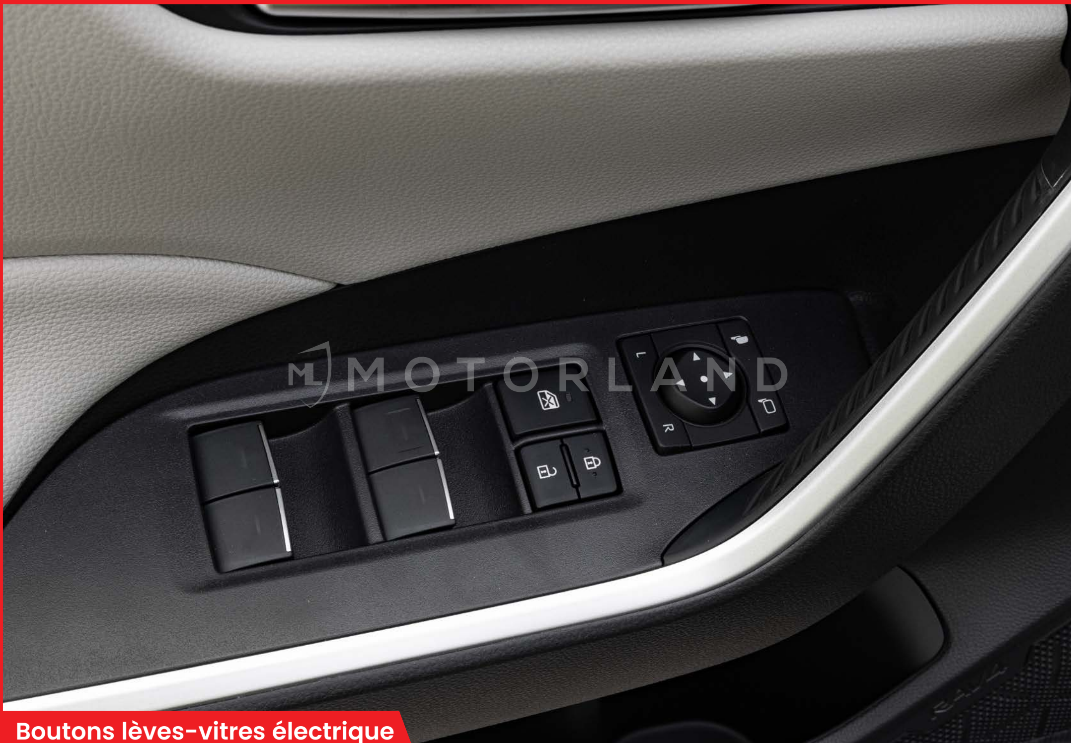
Boutons lèves-vitres électrique