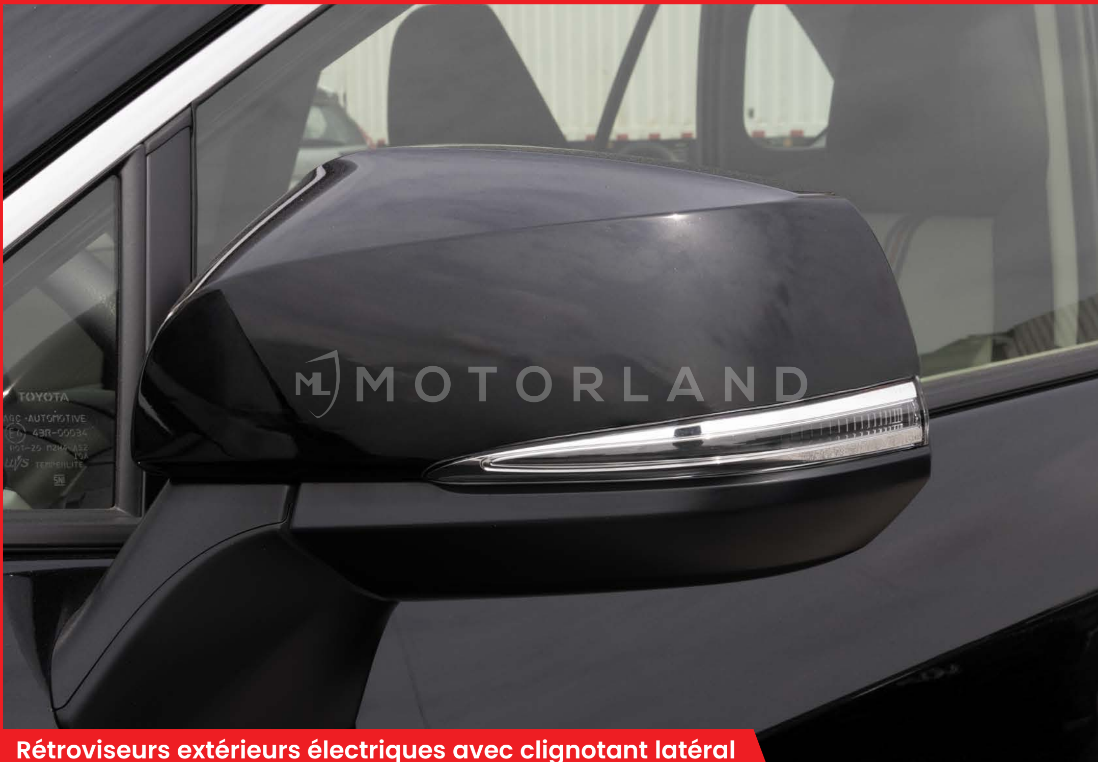
Rétroviseurs extérieurs électriques avec clignotant latéral