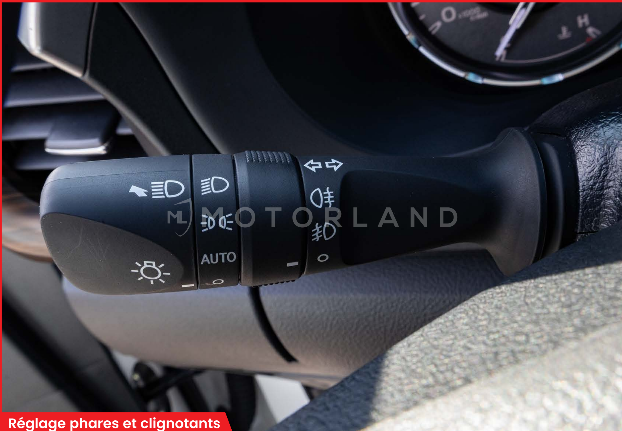
Réglage phares et clignotants