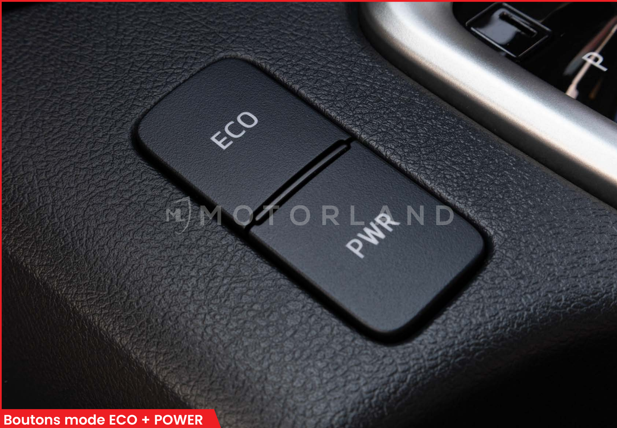
Boutons mode ECO + POWER