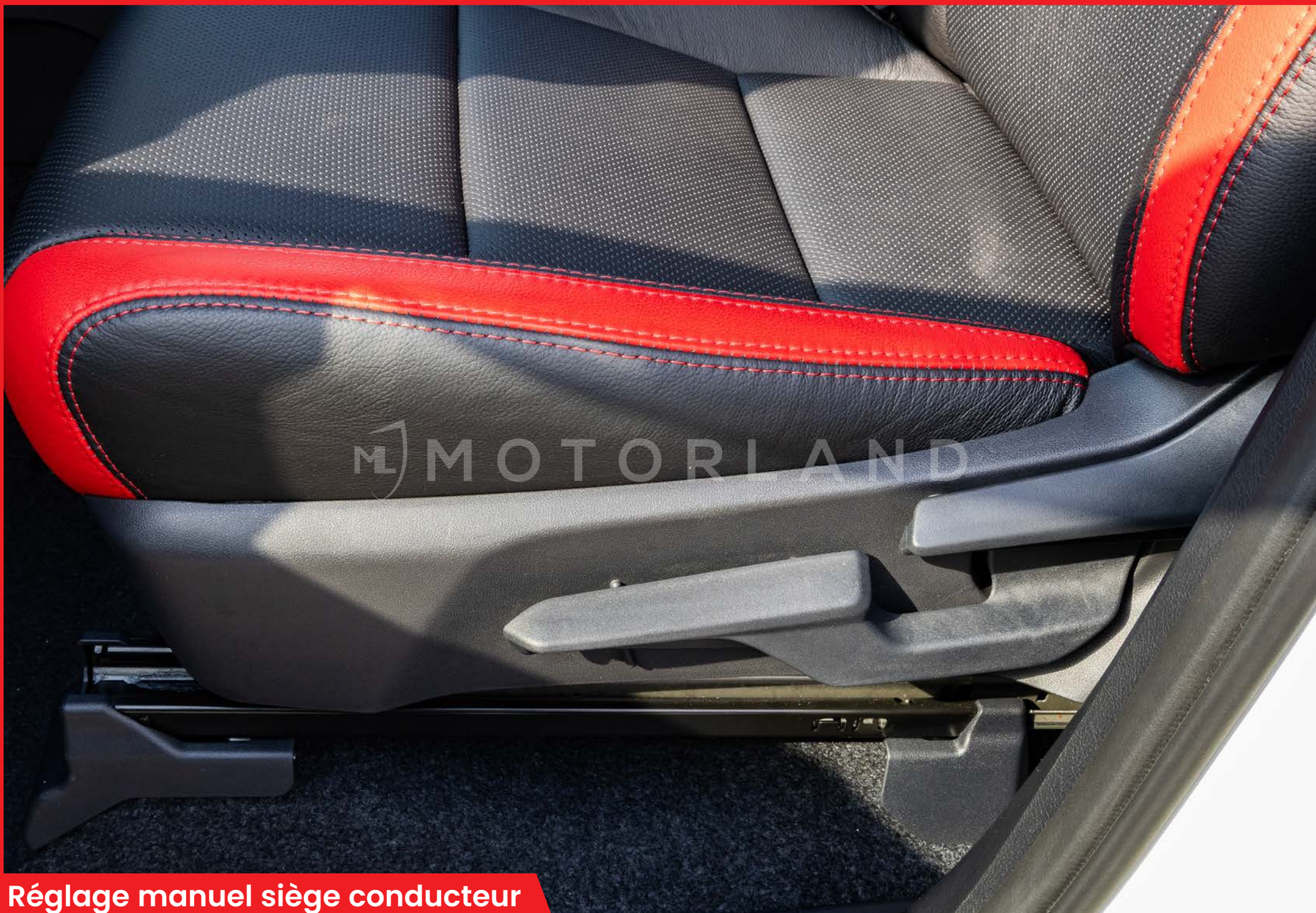
Réglage manuel siège conducteur