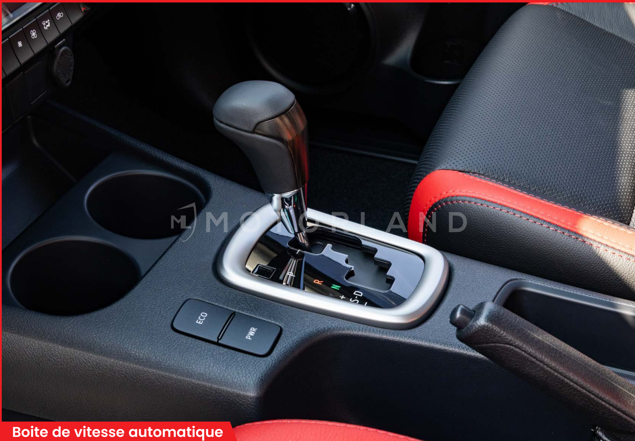
Boite de vitesse automatique