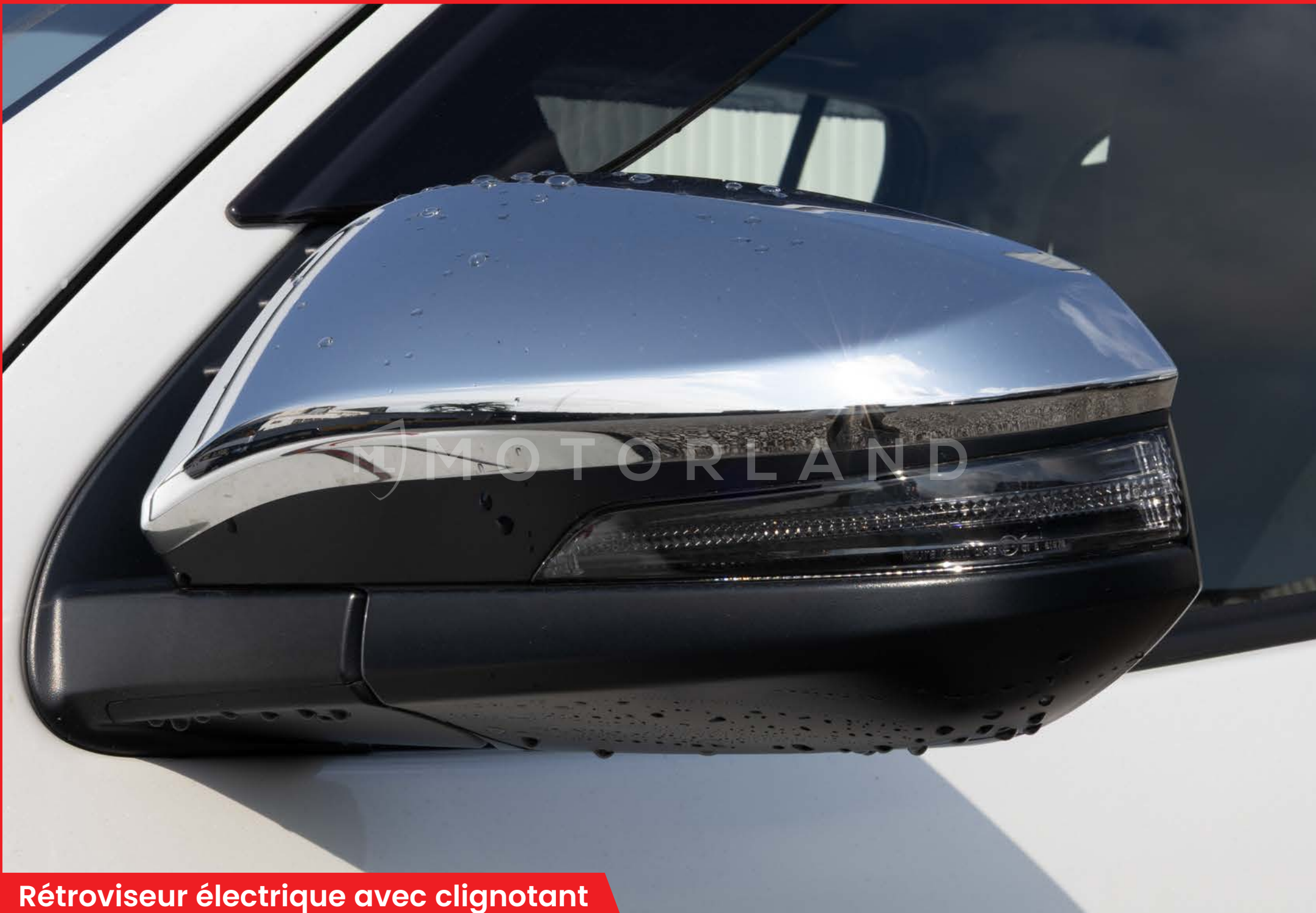
Rétroviseur électrique avec clignotant