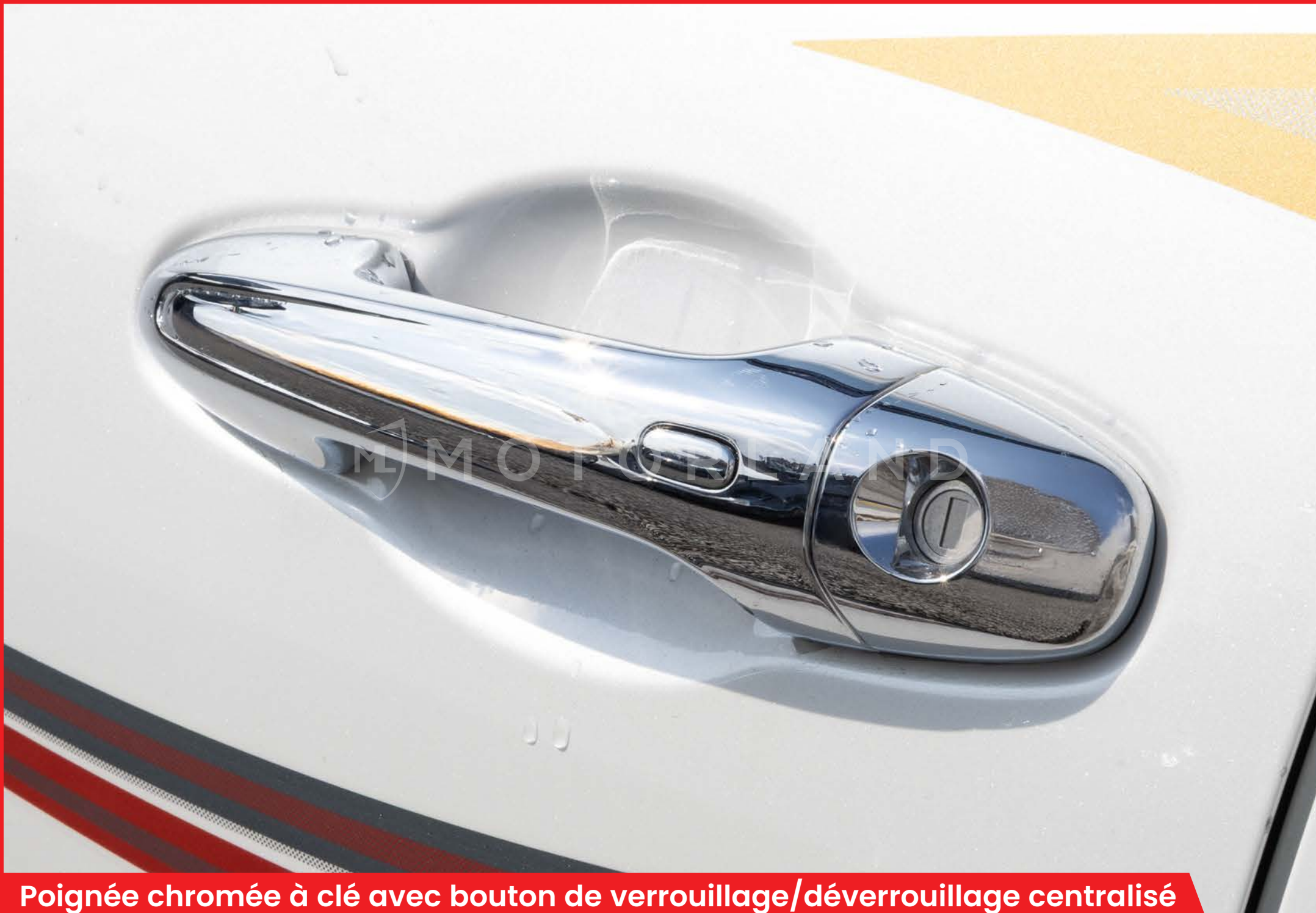
Poignée chromée à clé avec bouton de verrouillage/déverrouillage centralisé