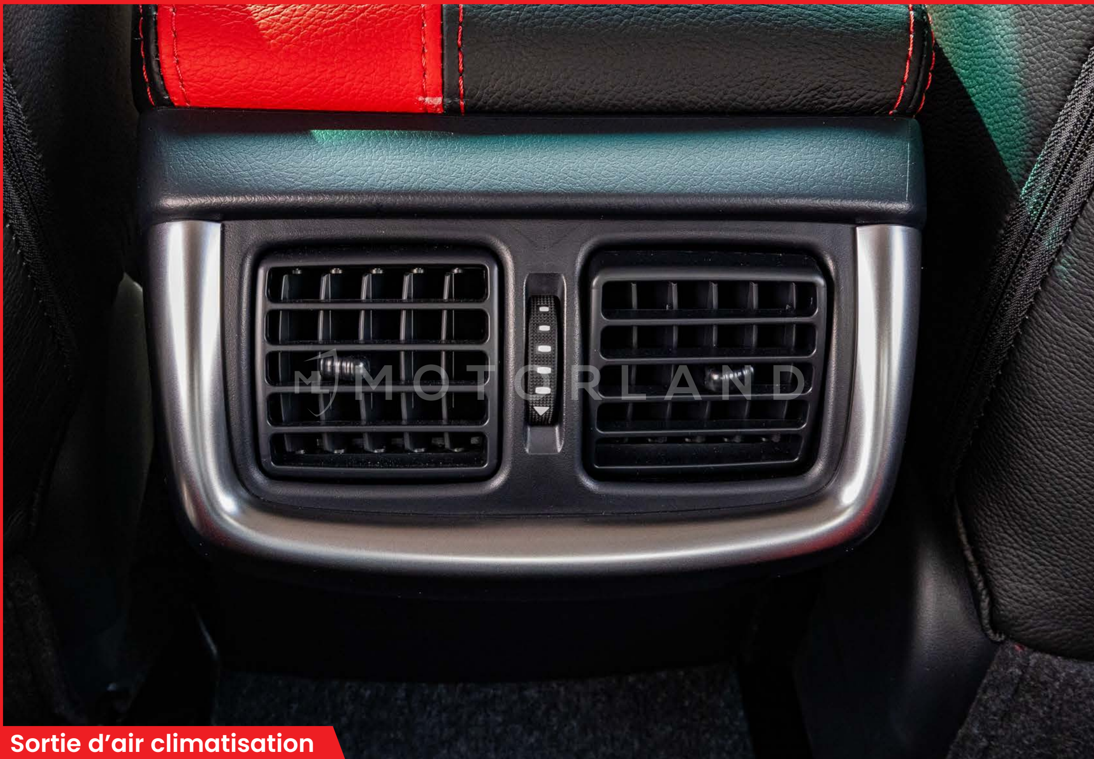
Sortie d'air climatisation