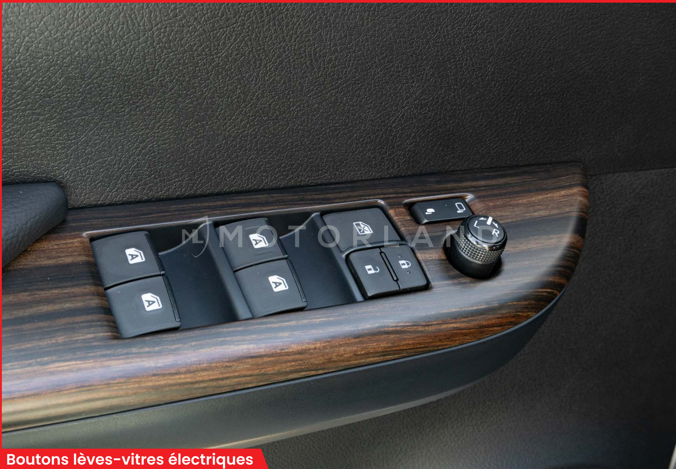
Boutons lèves-vitres électriques