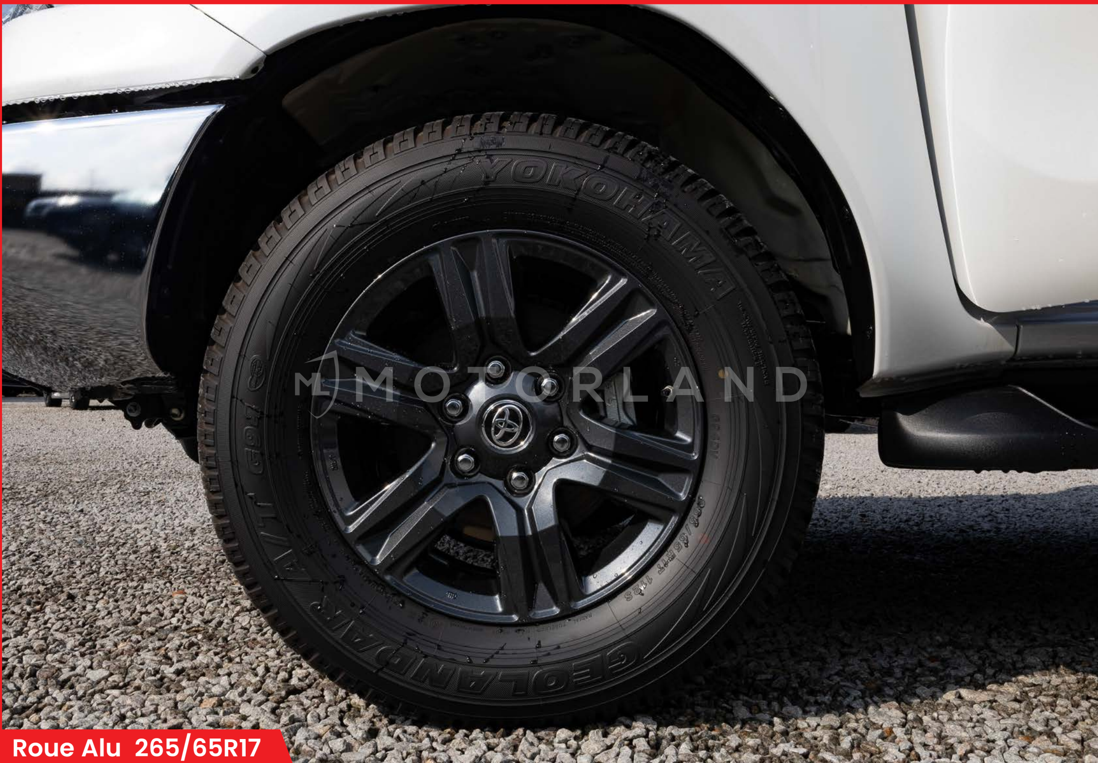
Roue Alu 265/65R17