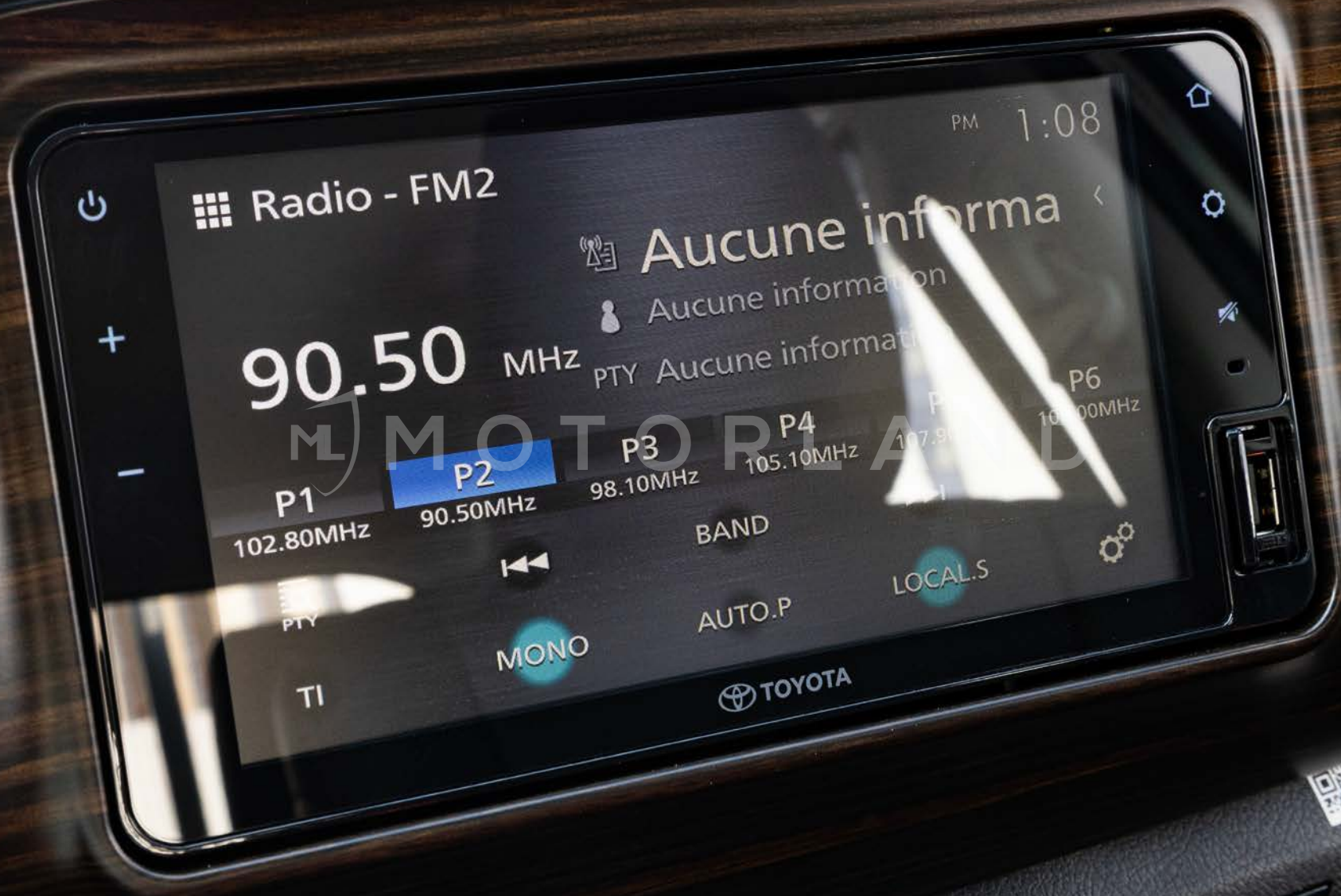
Ecran tactile 8"