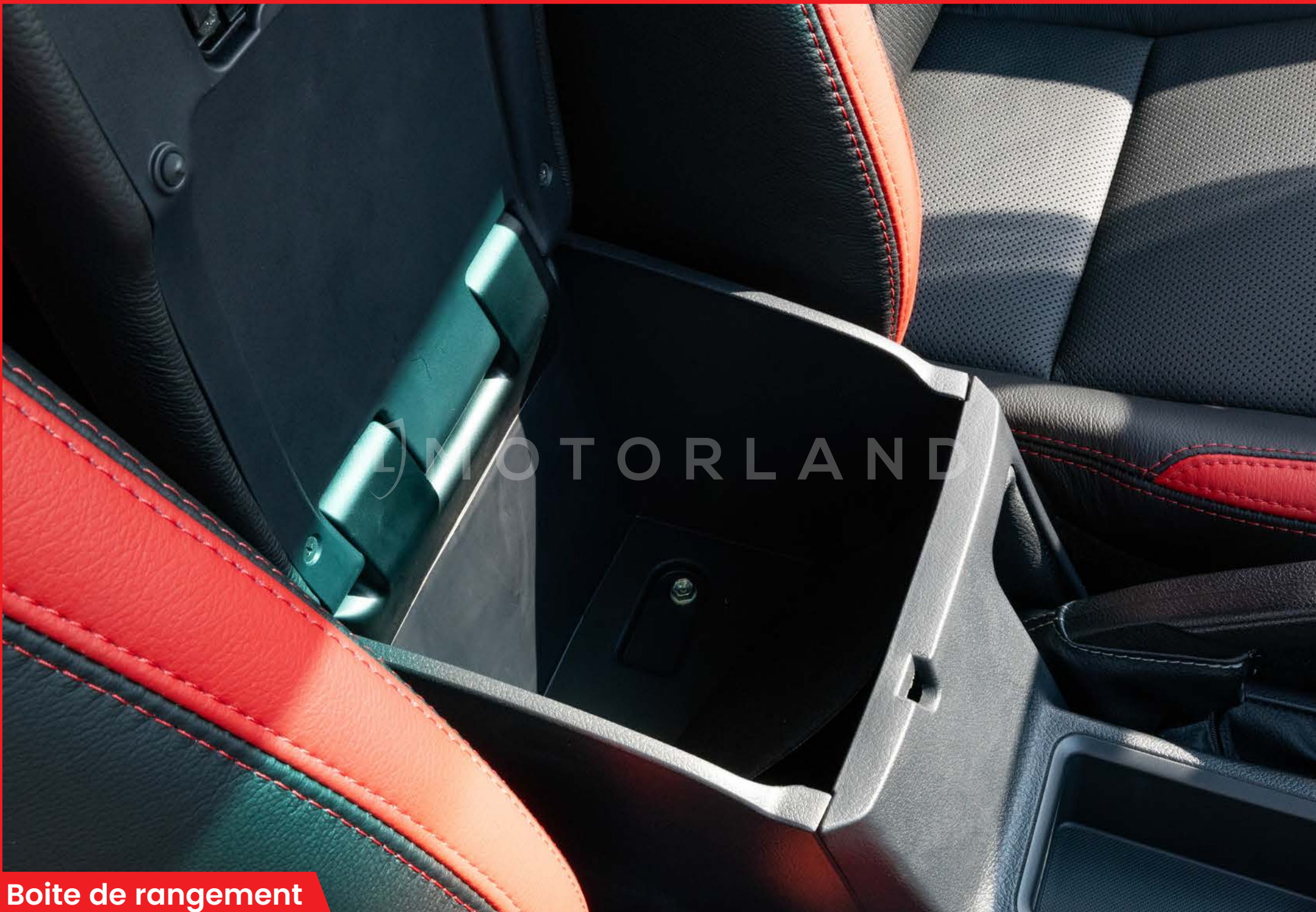
Boîte de rangement