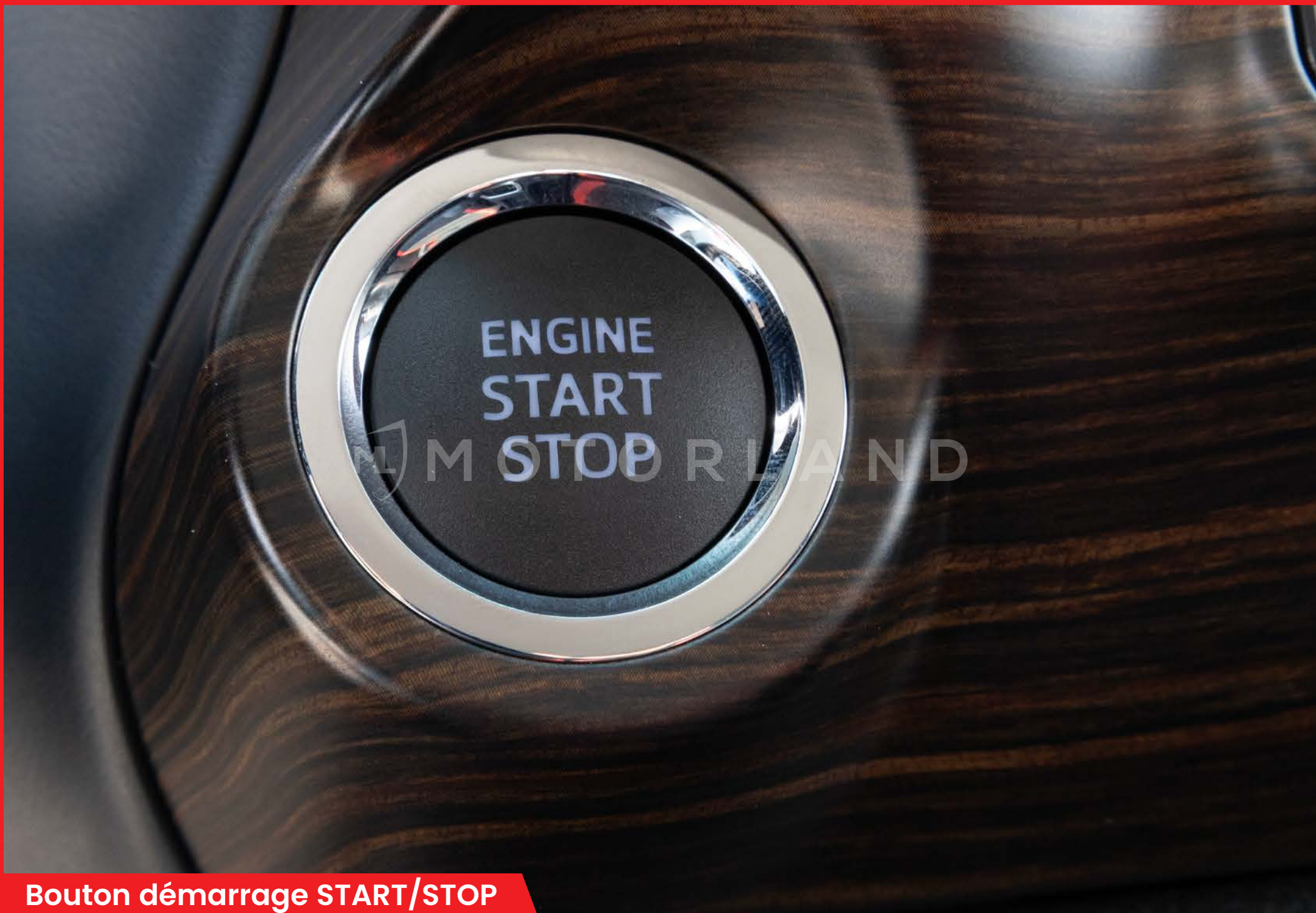
Bouton démarrage START/STOP