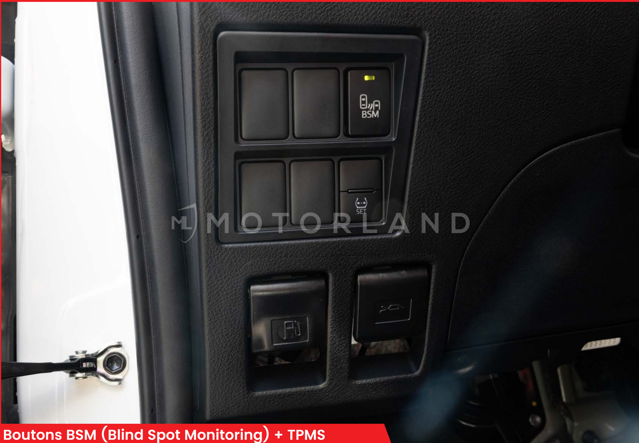
Boutons BSM (Blind Spot Monitoring) + TPMS