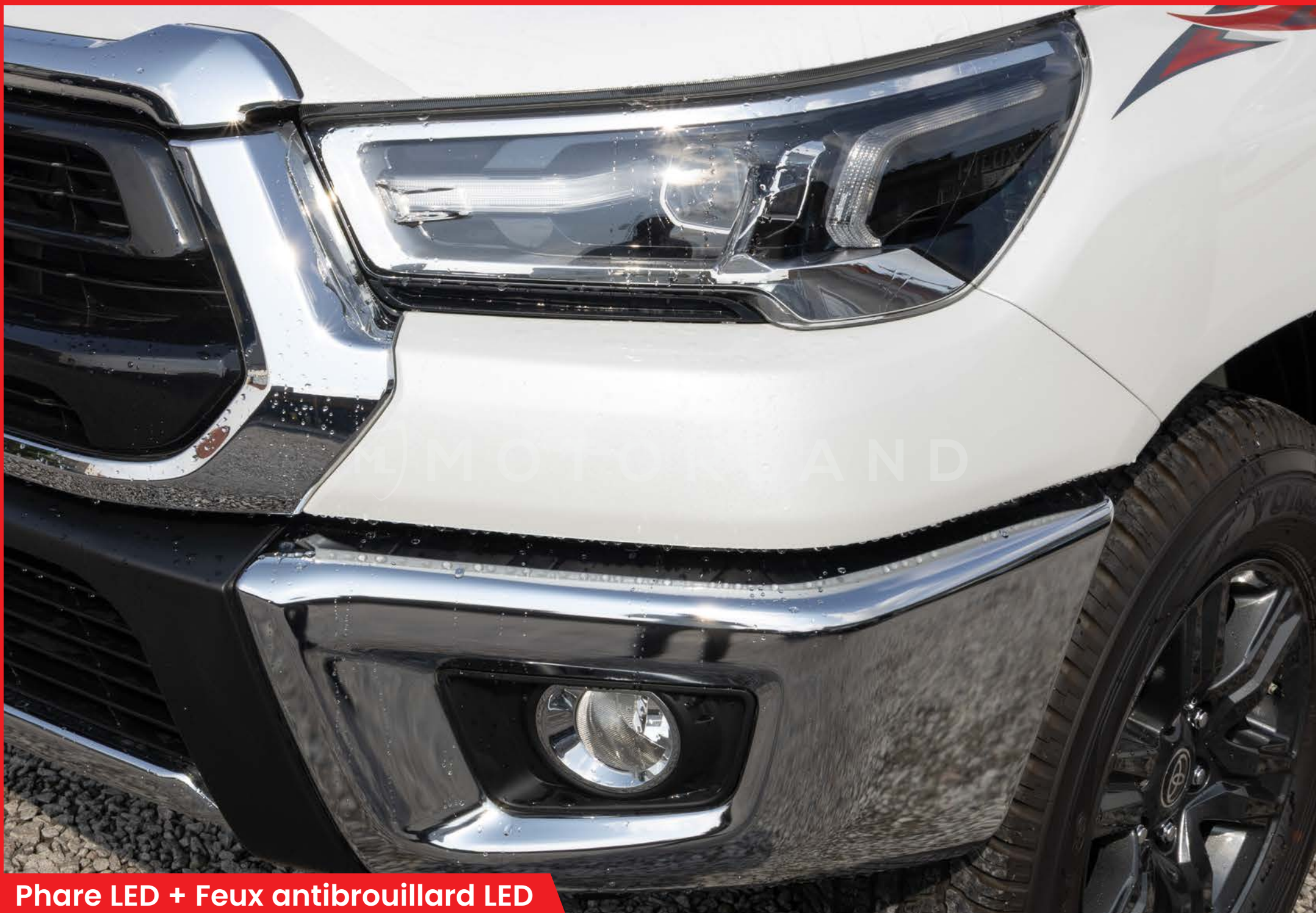
Phare LED + Feux antibrouillard LED