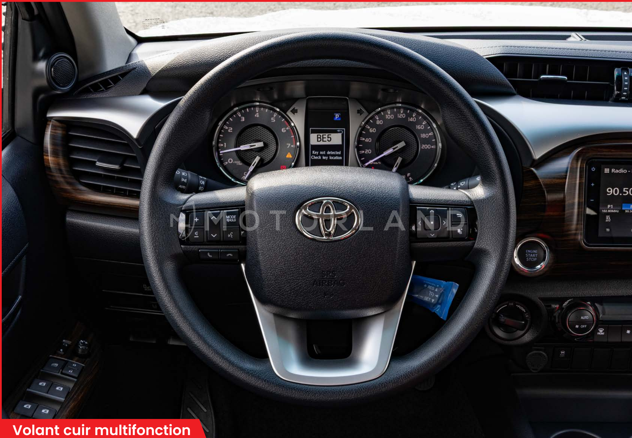
Volant cuir multifonction