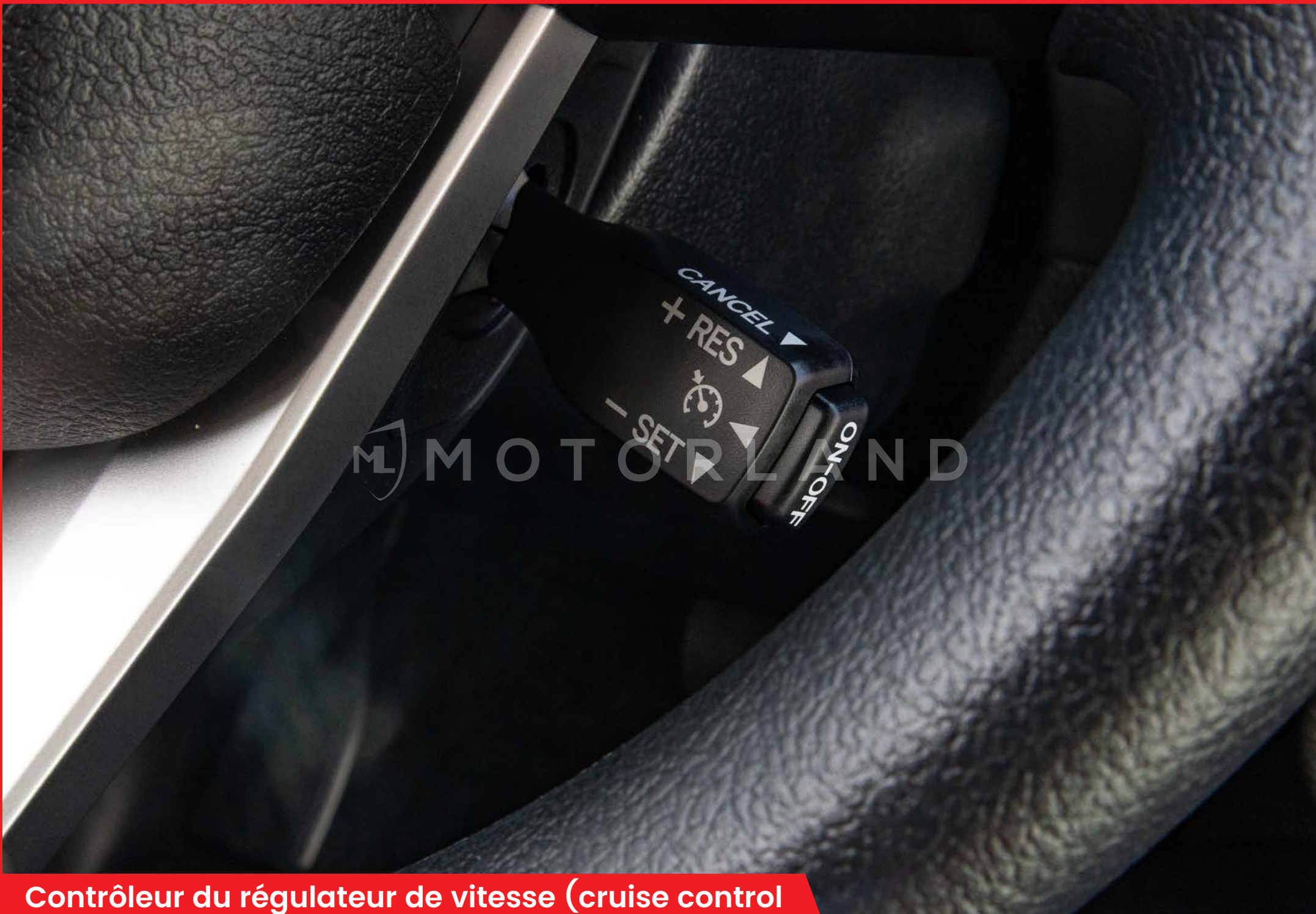
Contrôleur du régulateur de vitesse (cruise control)