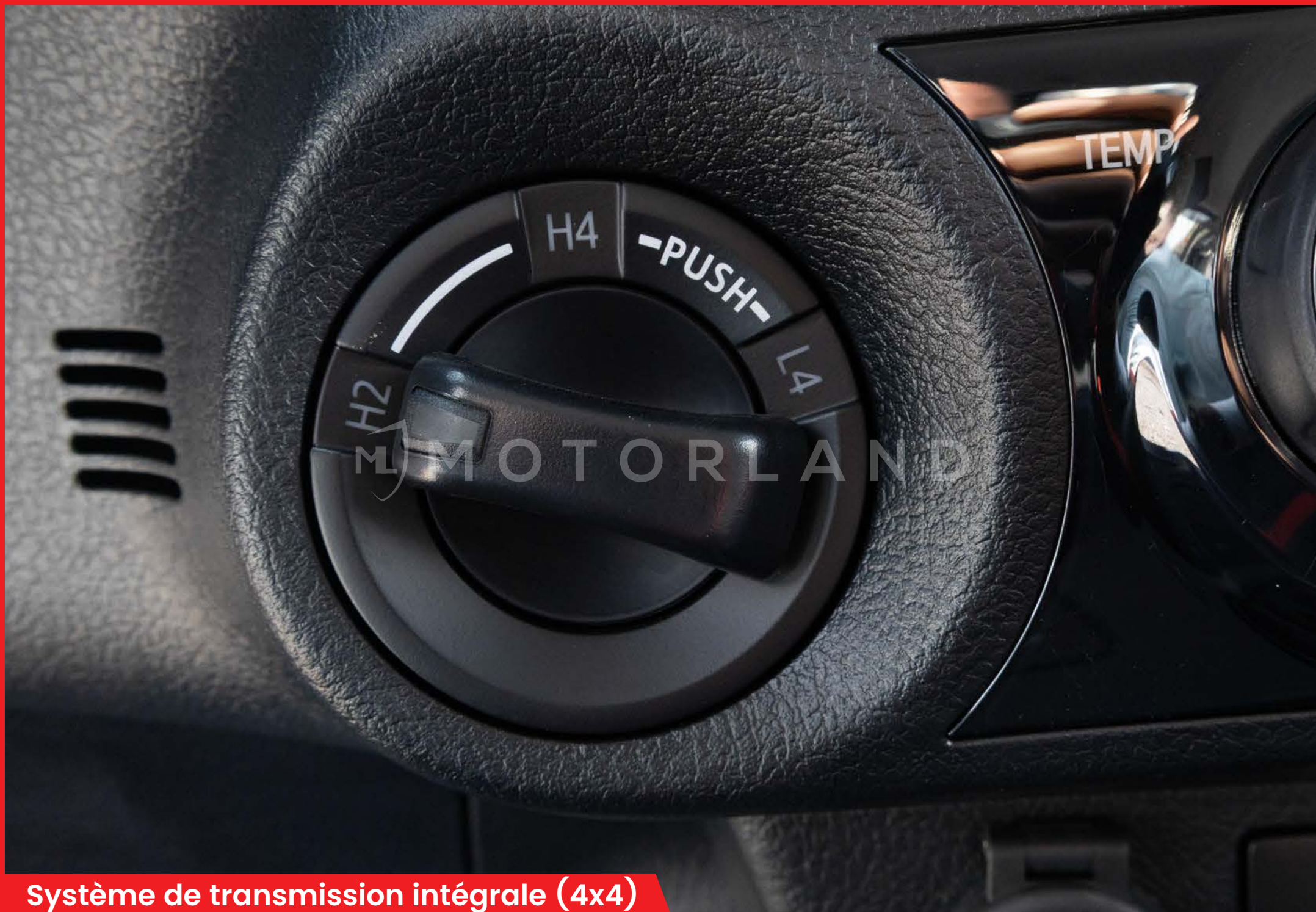
Systeme de transmission integrale (4x4)