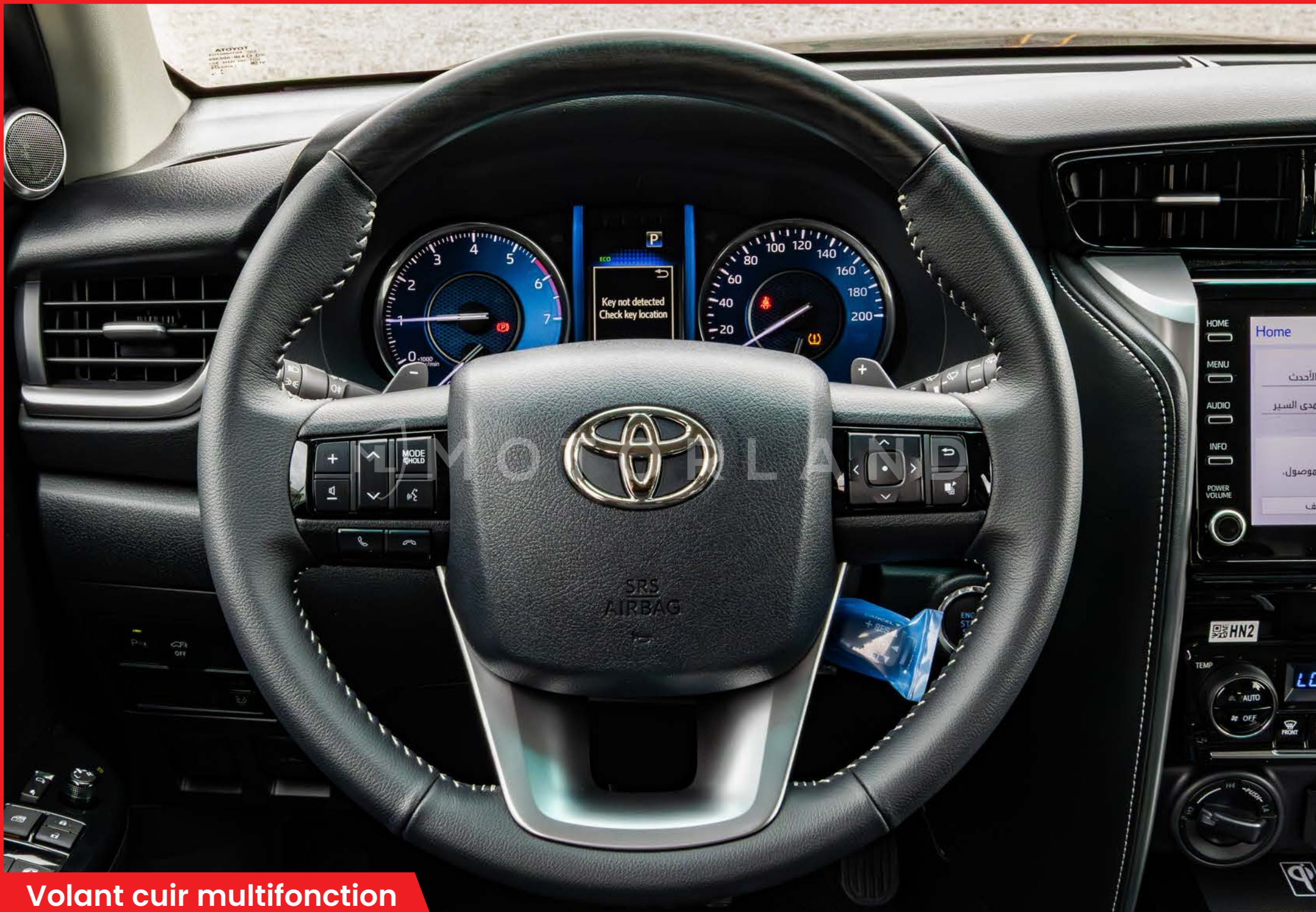
Volant cuir multifonction