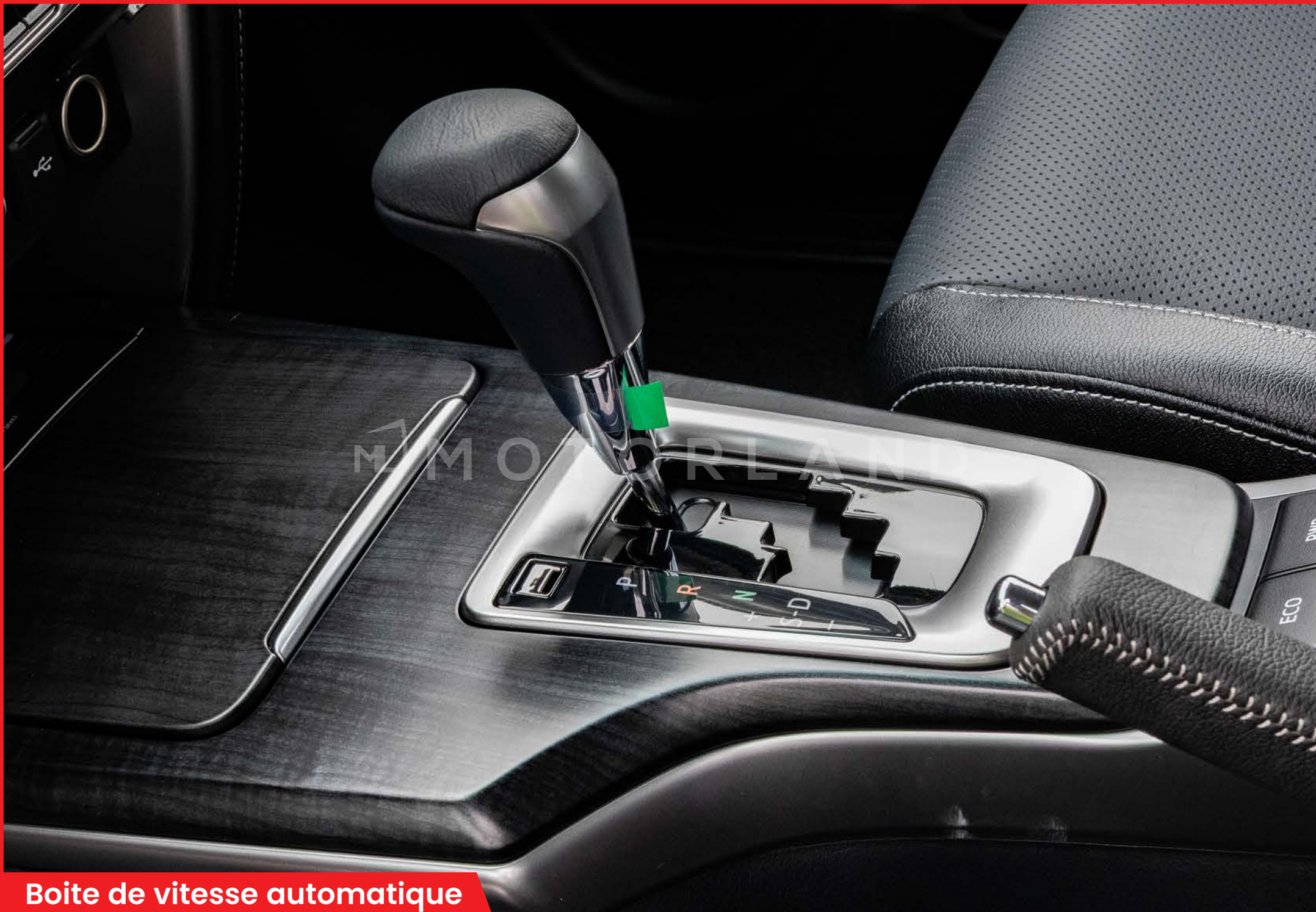
Boite de vitesse automatique