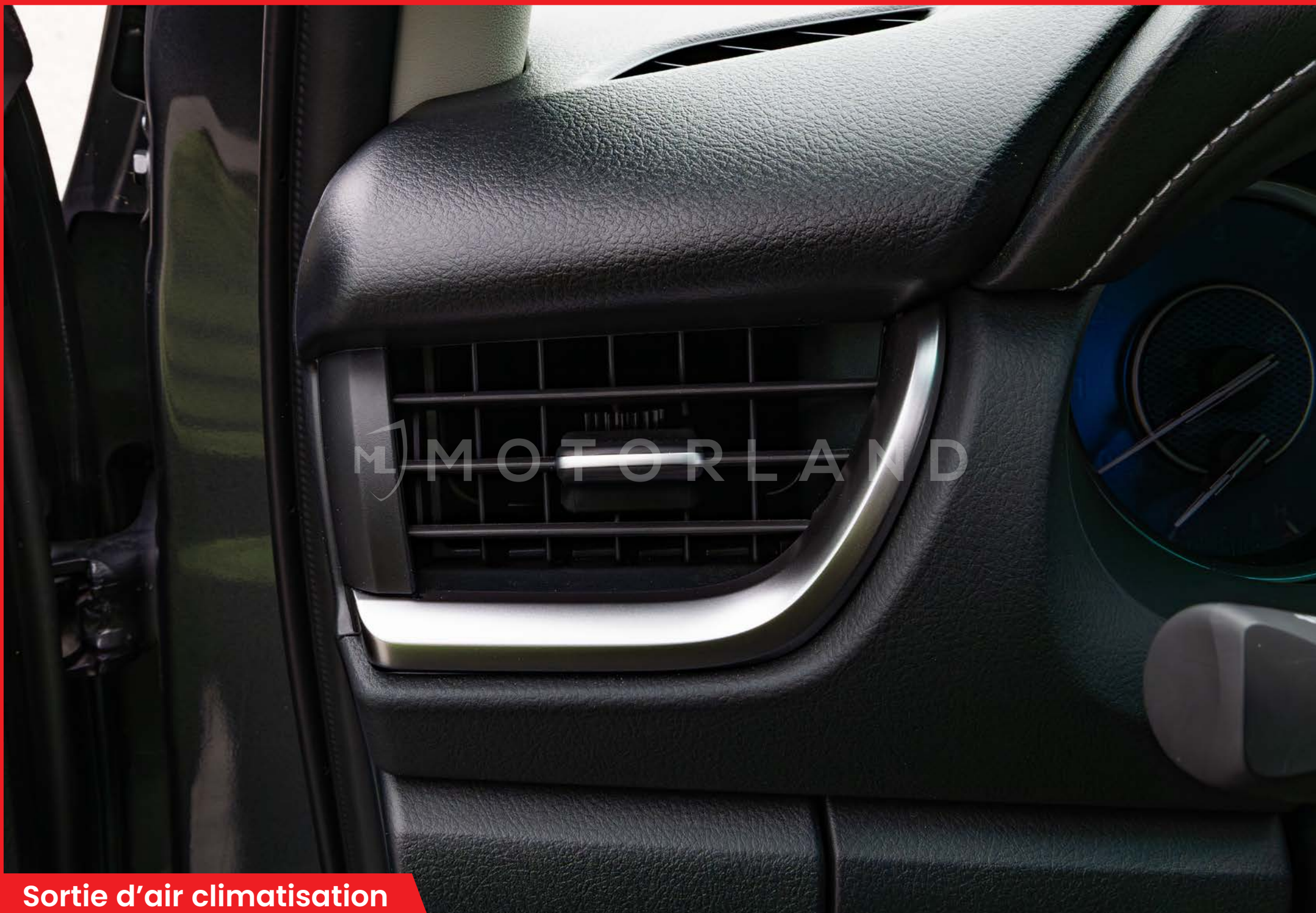
Sortie d'air climatisation