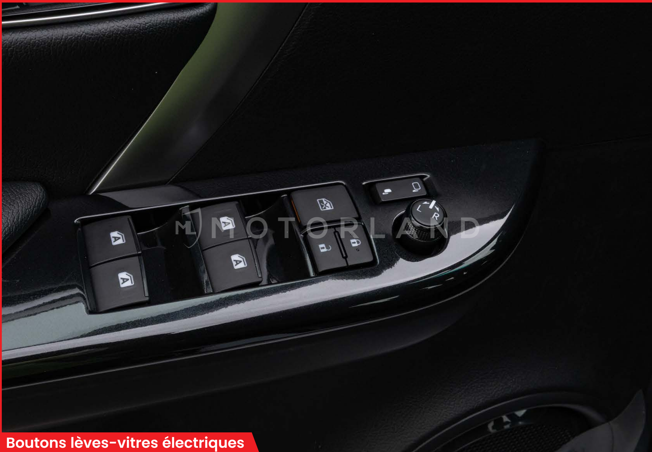
Boutons lèves-vitres électriques