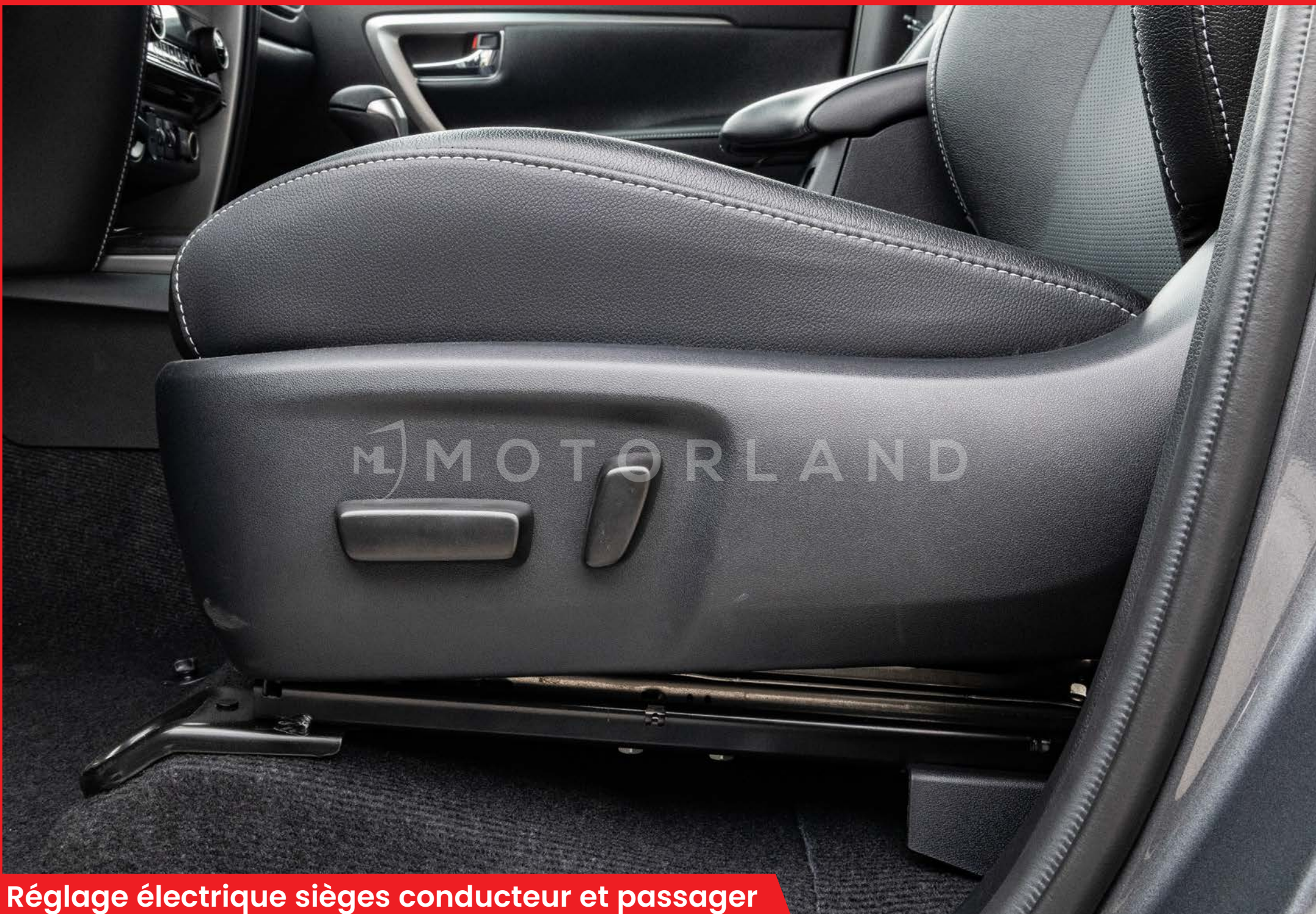
Réglage électrique sièges conducteur et passager