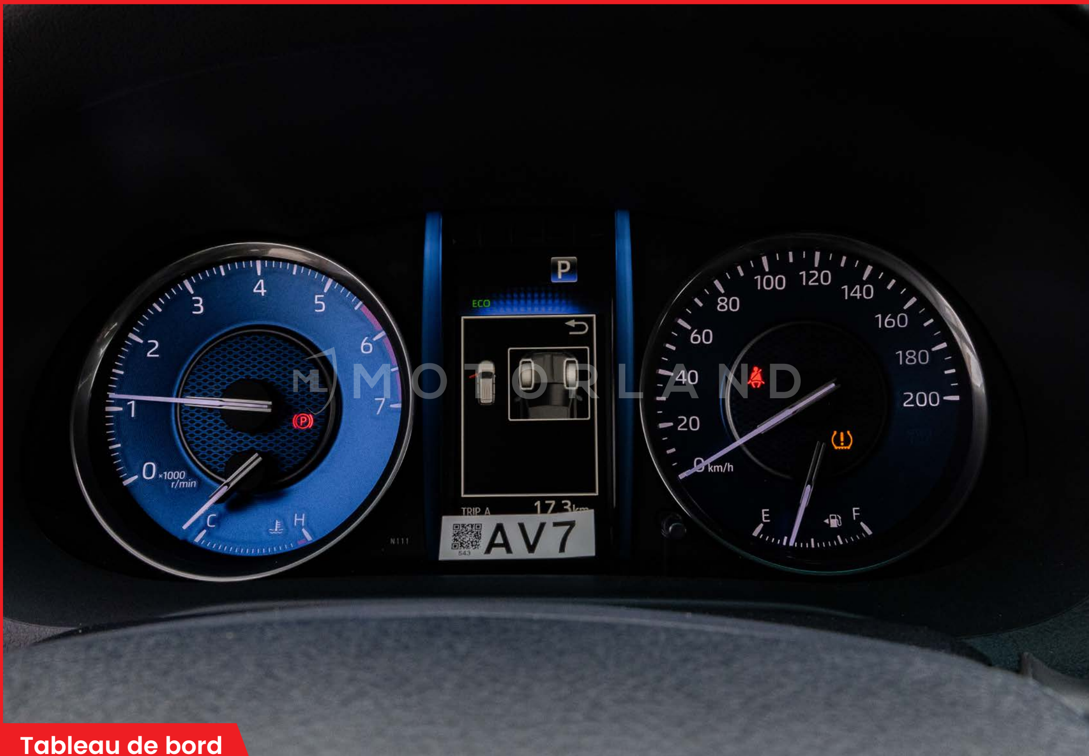
Tableau de bord