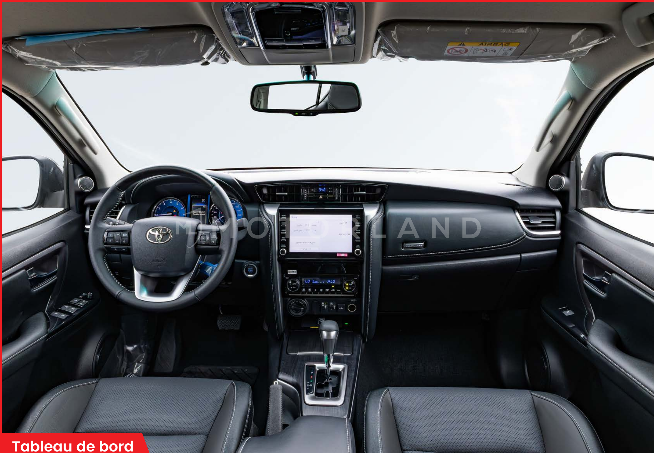
Tableau de bord