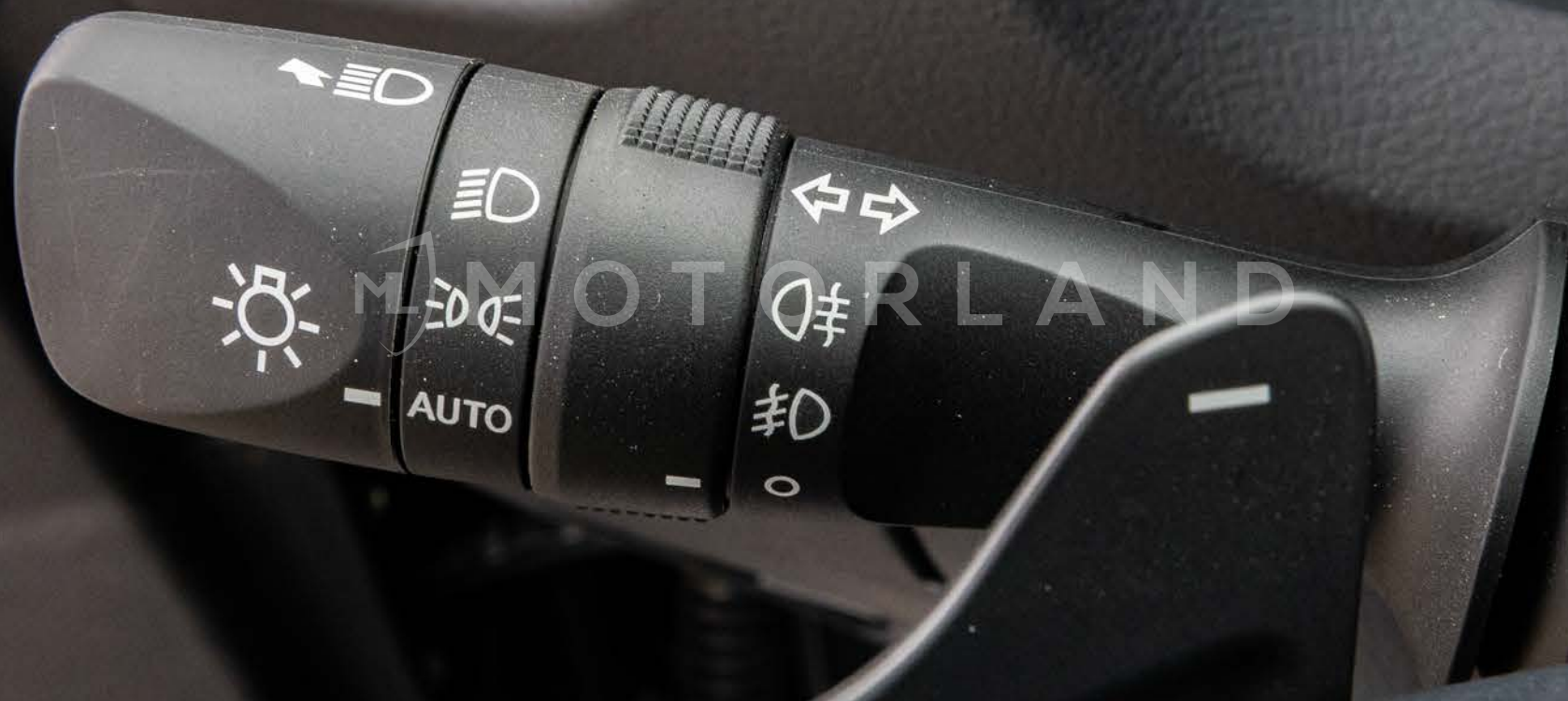
Réglage phares et clignotants