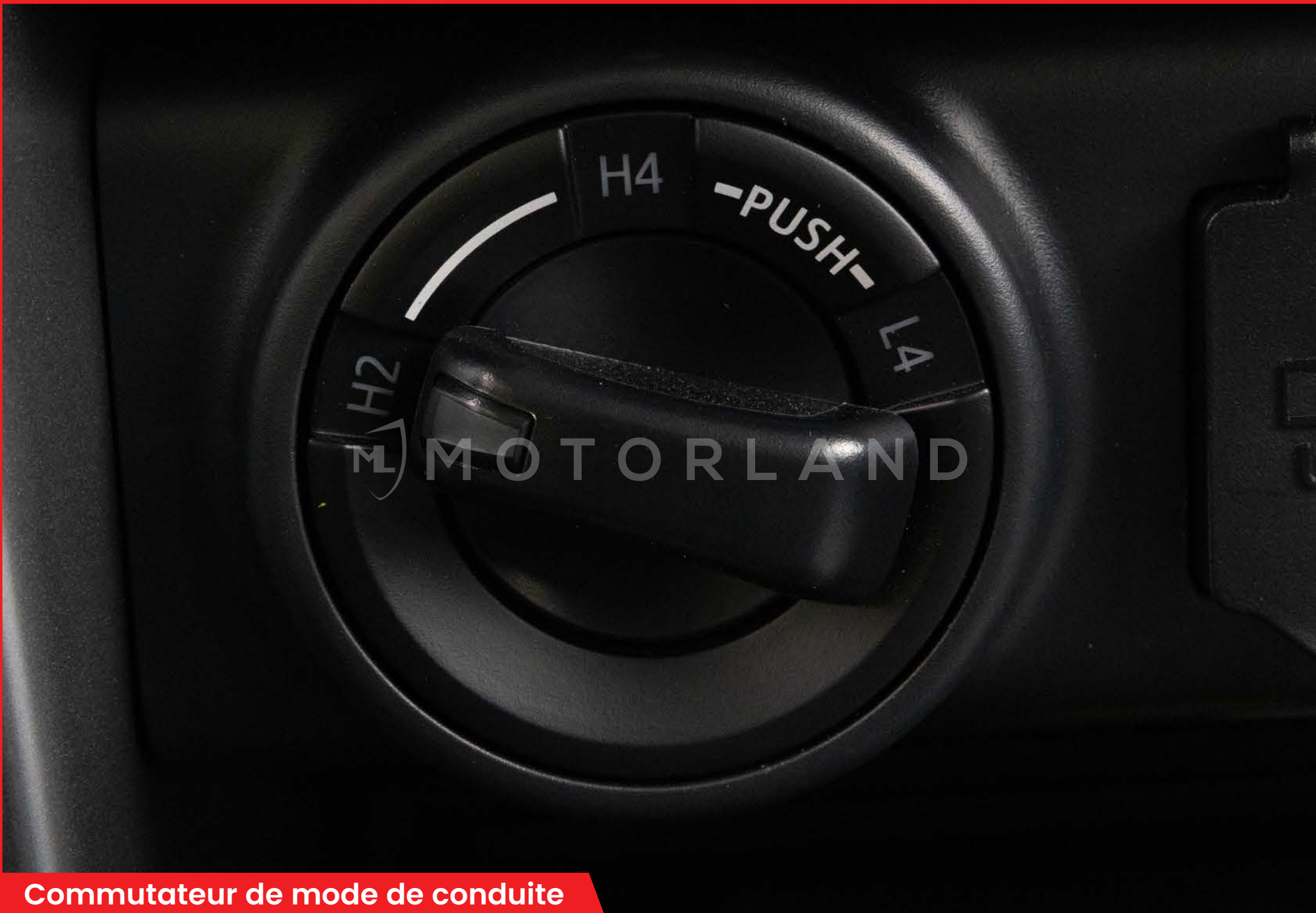
Commutateur de mode de conduite