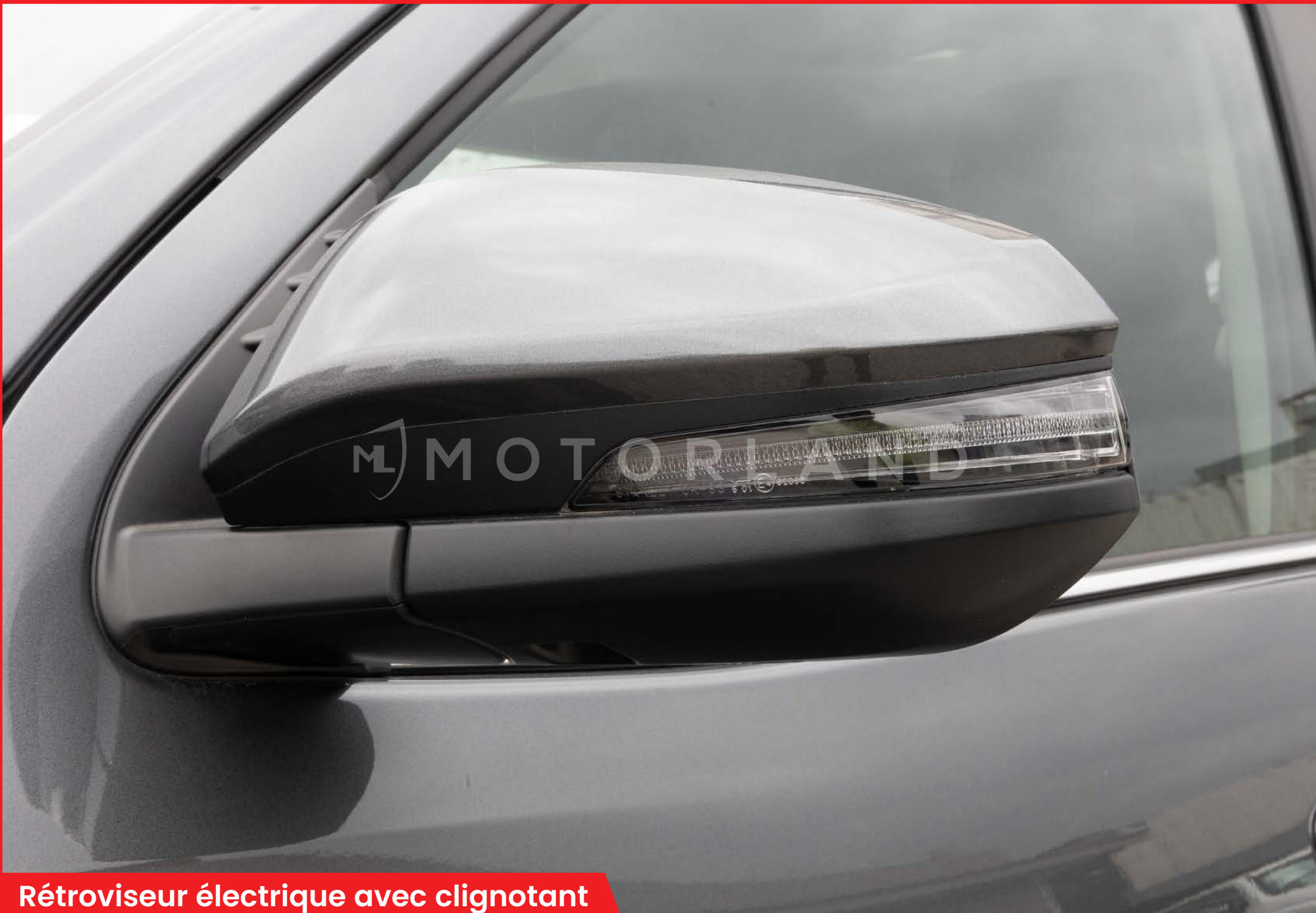
Rétroviseur électrique avec clignotant