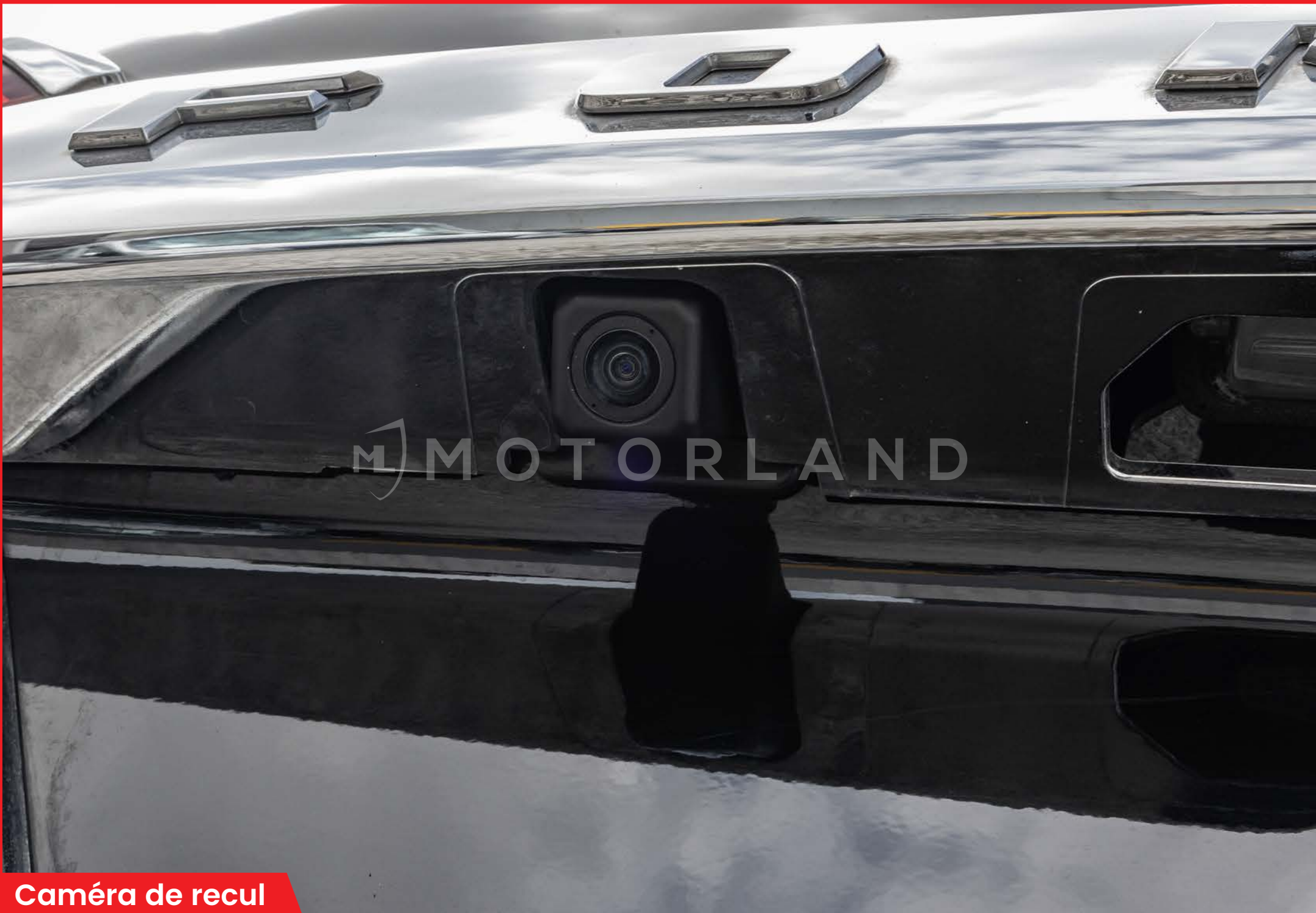
Caméra de recul