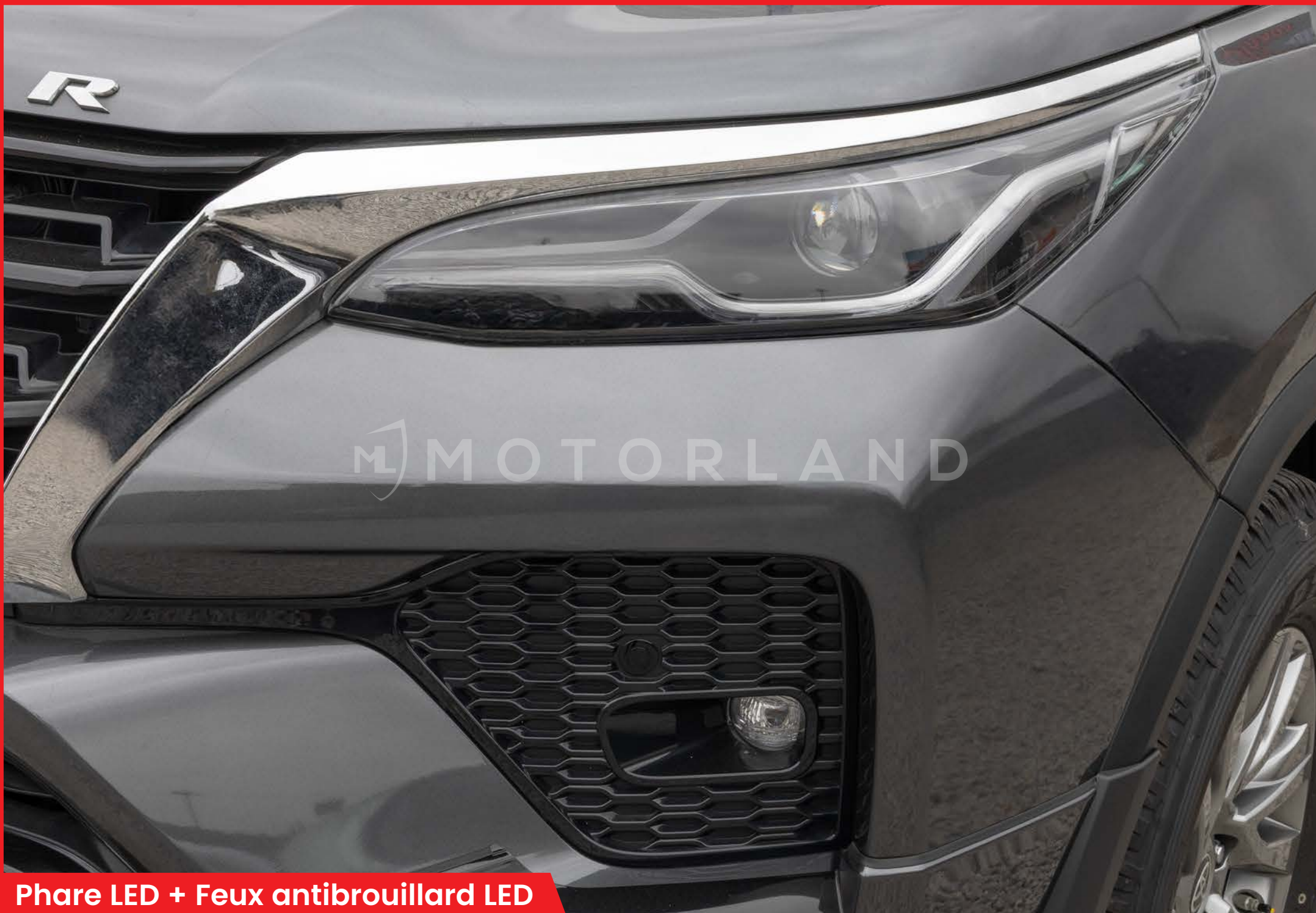
Phare LED + Feux antibrouillard LED