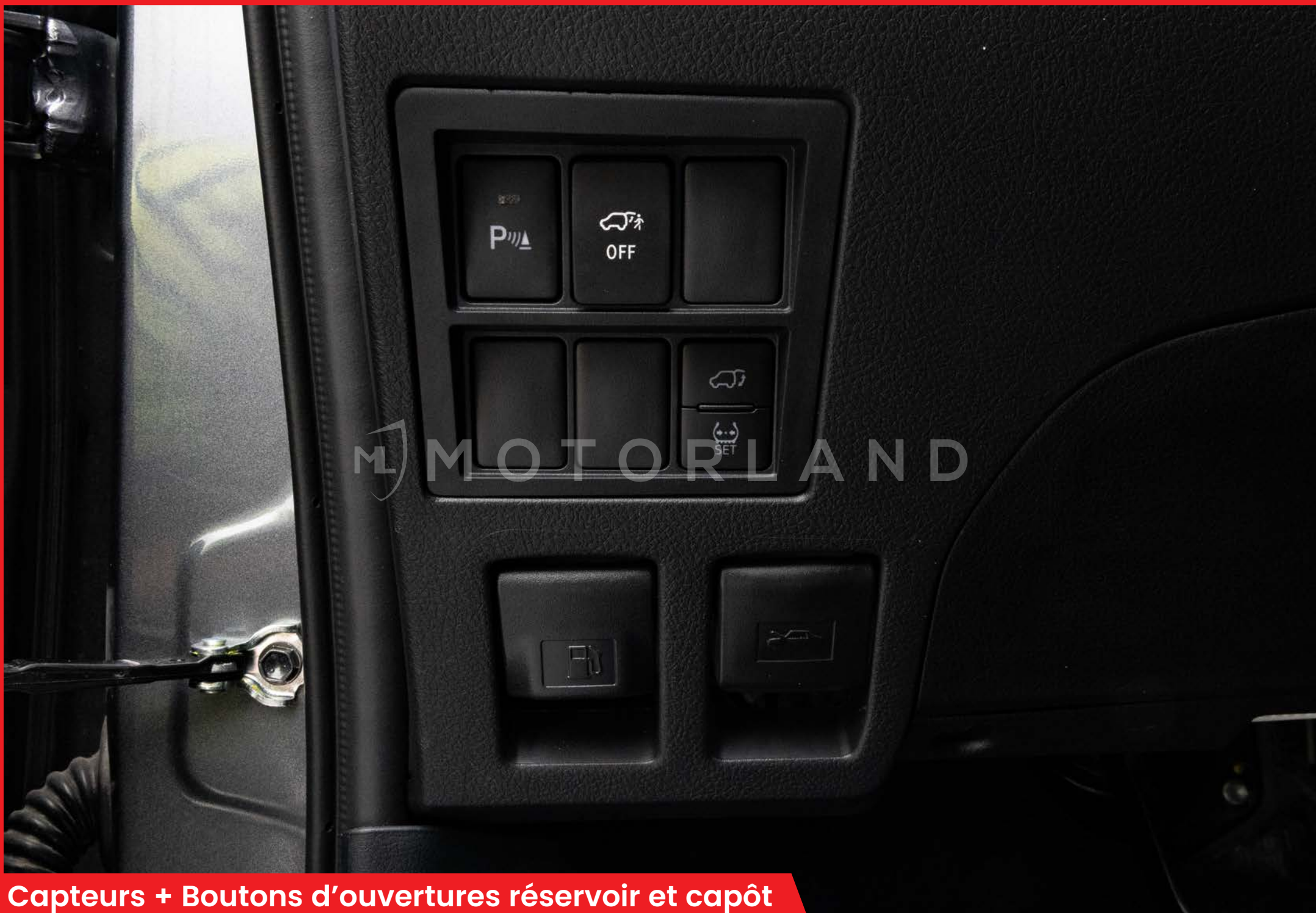
Capteurs + Boutons d'ouvertures réservoir et capôt