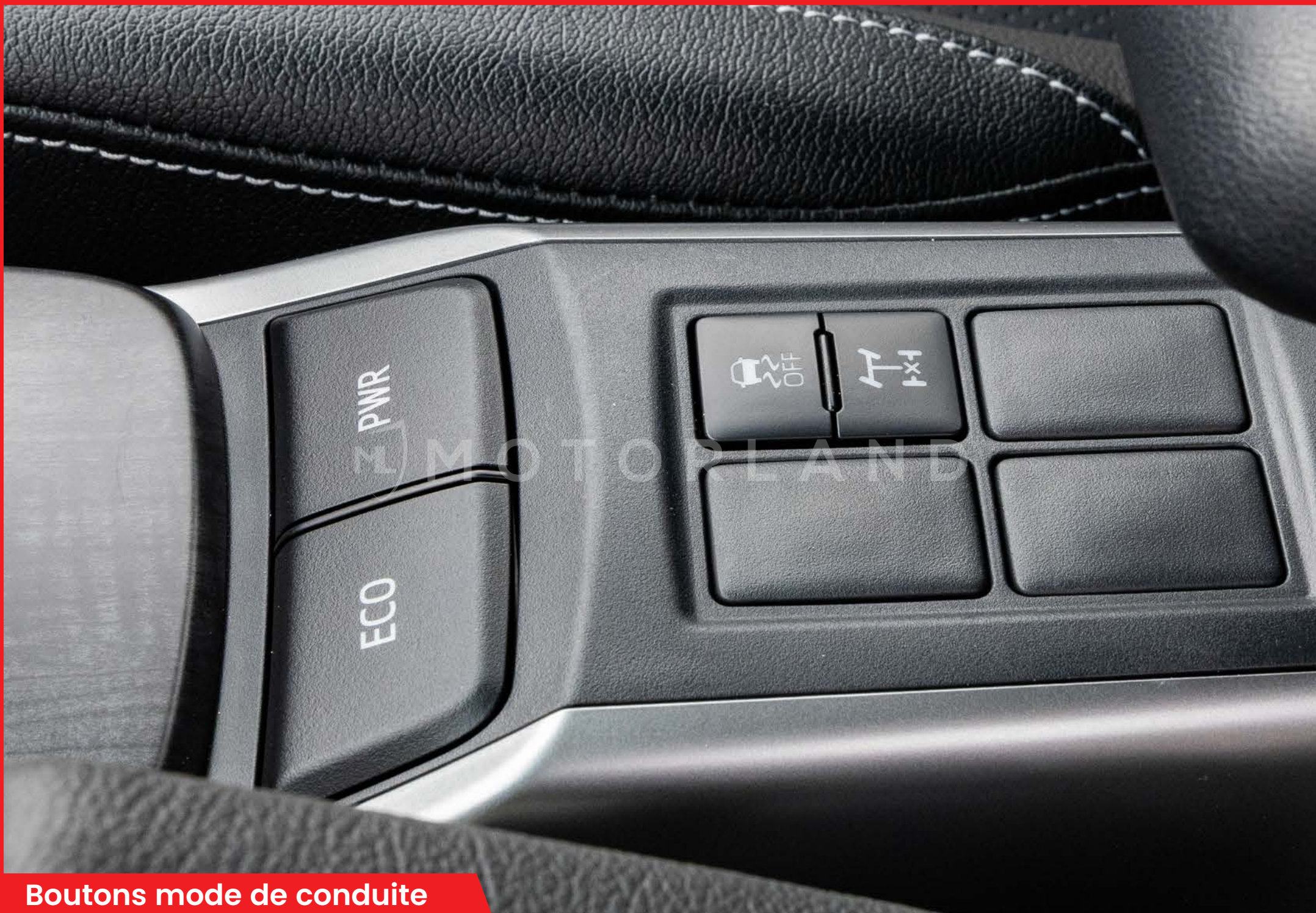
Boutons mode de conduite